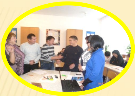
Қолайлы орта құру