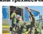
Процой, общага, «дздравствуй, казарма!»

Группа ректоров вузов предлагает Минобороны отправлять студентов по 3 месяца в году проходить срочную службу. И так 3 года подряд. Чему научатся студенты за такой срок и чем это поможет армии? Н. Капустин, Клин