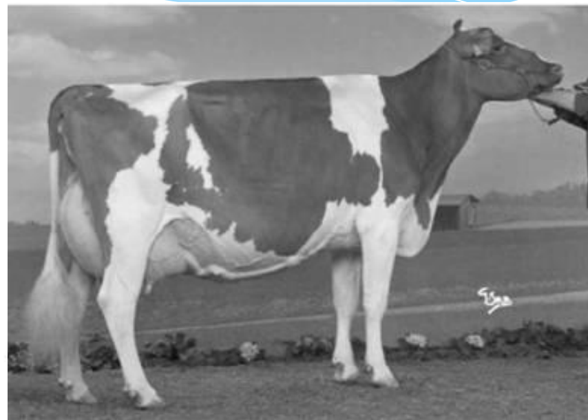
Стати молочной коровы:

1 — затылочный гребень; 2 — загривок; 3 — лопатка; 4 — холка; 5 — спина; 6 — поясница; 7 — крестец; 8 — седалищные бугры; 9 — маклоки; 10 — бедро; 11 — коленная чашечка; 12 — ляжка; 13 — скакательный сустав; 14 — кисть хвоста; 15 — вымя; 16 — молочные вены; 17 — молочные колодцы; 18 — бабки (путь); 19 — пясть; 20 — запястье; 21 — подплечье; 22 — локоть; 23 — копыто.