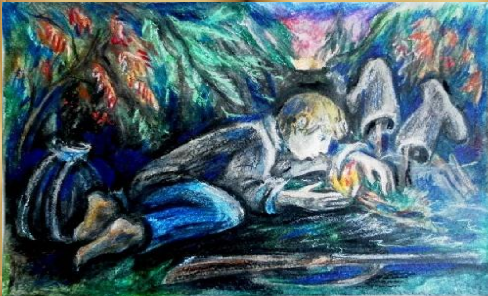
ВАСЮТКИНО ОЗЕРЦО - последняя сценка

Прочитайте отрывок, в котором говорится о том, как Васютка приготовился к ужину, а, съев свою первую добычу, лёг спать. Стр 134 .