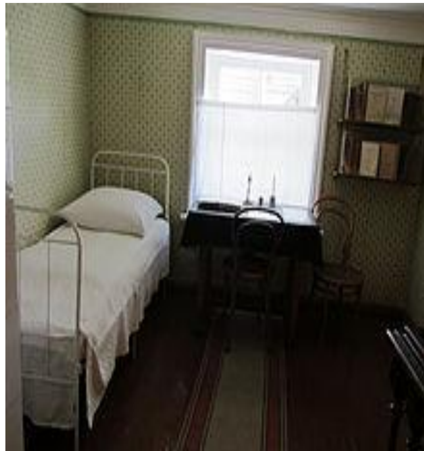
Комната В. И. Ленина, в которой он прожил с 1878 по 1887 год. Ныне Дом-музей семьи Ульяновых