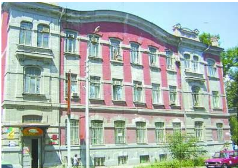
Здание сохранилось и в наше время (находится на пересечении улиц Вольской и Сакко и Ванцетти)

Еще летом 1914 года, после начала 19 июля Первой мировой войны, Булгаков принял участие в организации лазарета для раненых при Казенной палате в Саратове и работал там врачом.