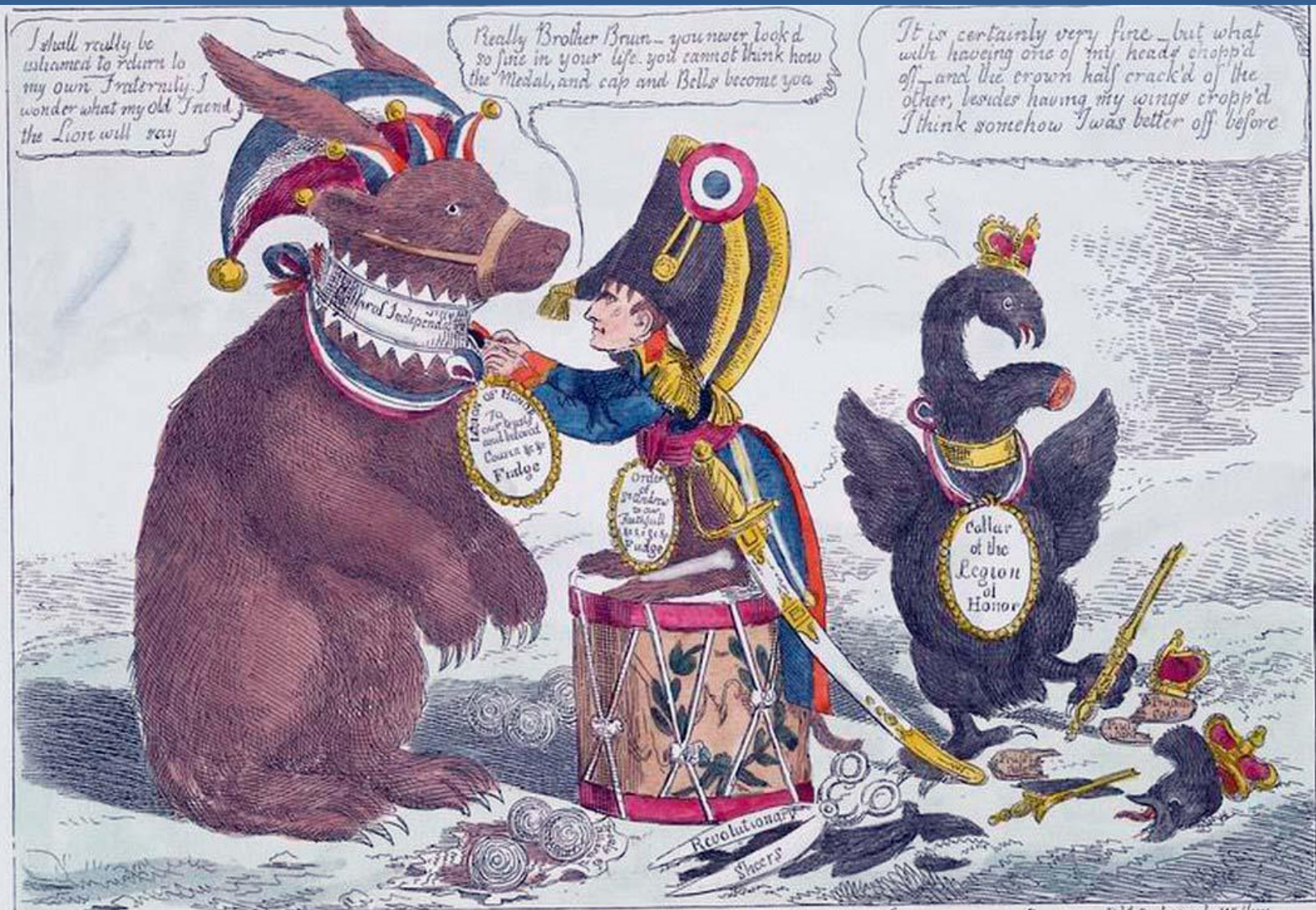
MUTUAL-HONORS at TILSIT or the Monkey the Bear and the Eagle