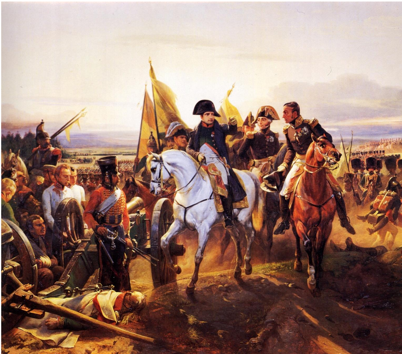
Сражение при Фридланде, 1807г.