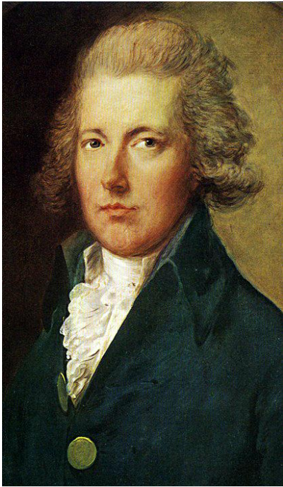
Премьер-министр Великобритании, Уильям Питт Младший.

В 1800 года британским флотом стратегически расположенного острова Мальта, который Павел I в качестве великого магистра Мальтийского ордена считал подчинённой территорией и потенциальной средиземноморской базой для русского флота. Это было воспринято Павлом как личное оскорбление.