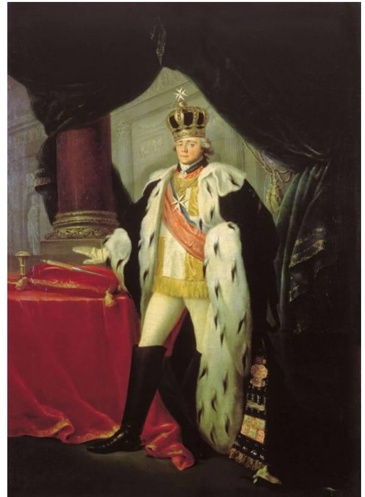
С. Тончи. Портрет Павла I в одеянии гроссмейстера Мальтийского ордена

В 1800 года британским флотом стратегически расположенного острова Мальта, который Павел I в качестве великого магистра Мальтийского ордена считал подчинённой территорией и потенциальной средиземноморской базой для русского флота. Это было воспринято Павлом как личное оскорбление.