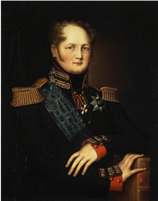
Александр I (Благословенный)