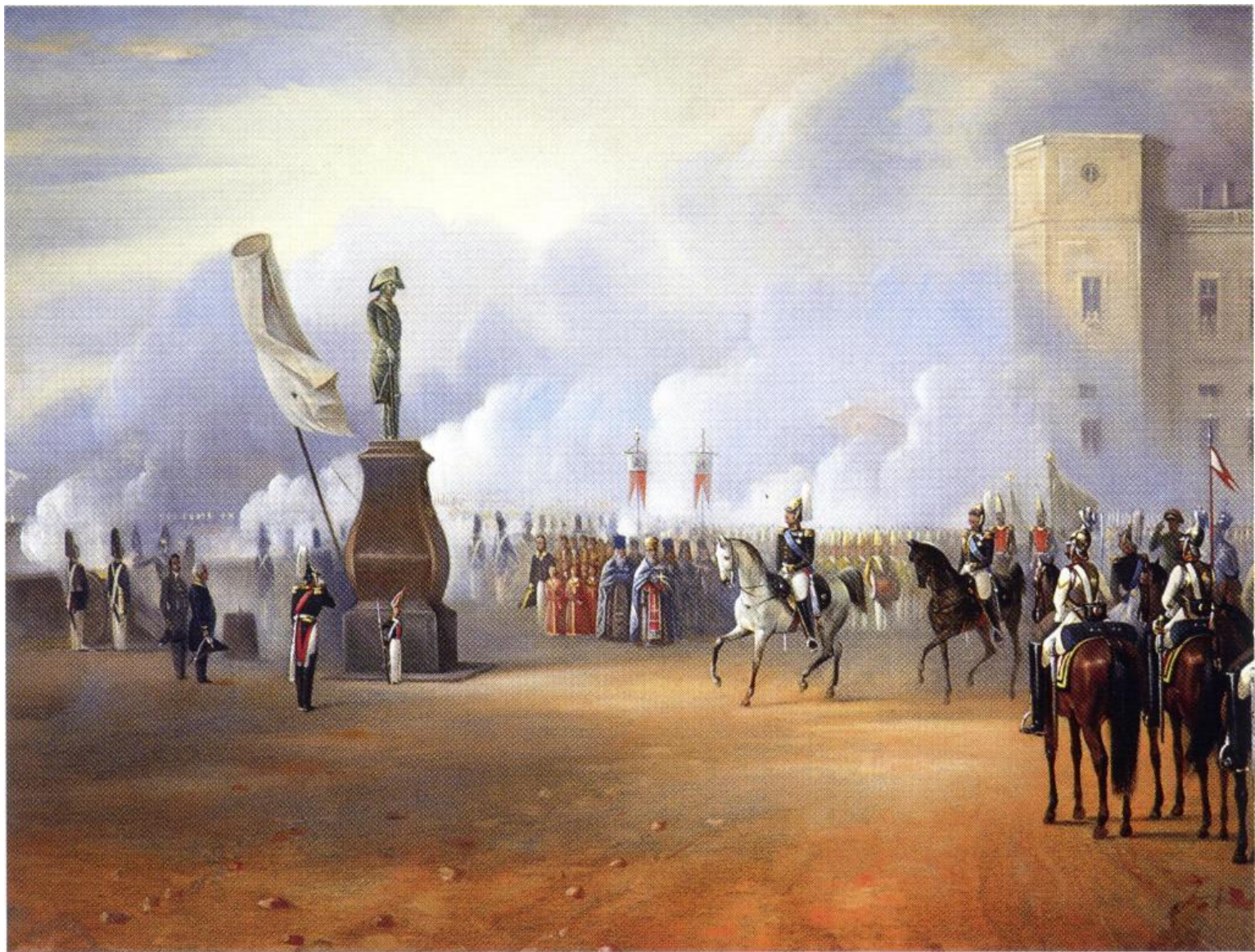
Неизвестный художник. Открытие памятника императору Павлу I. 1851