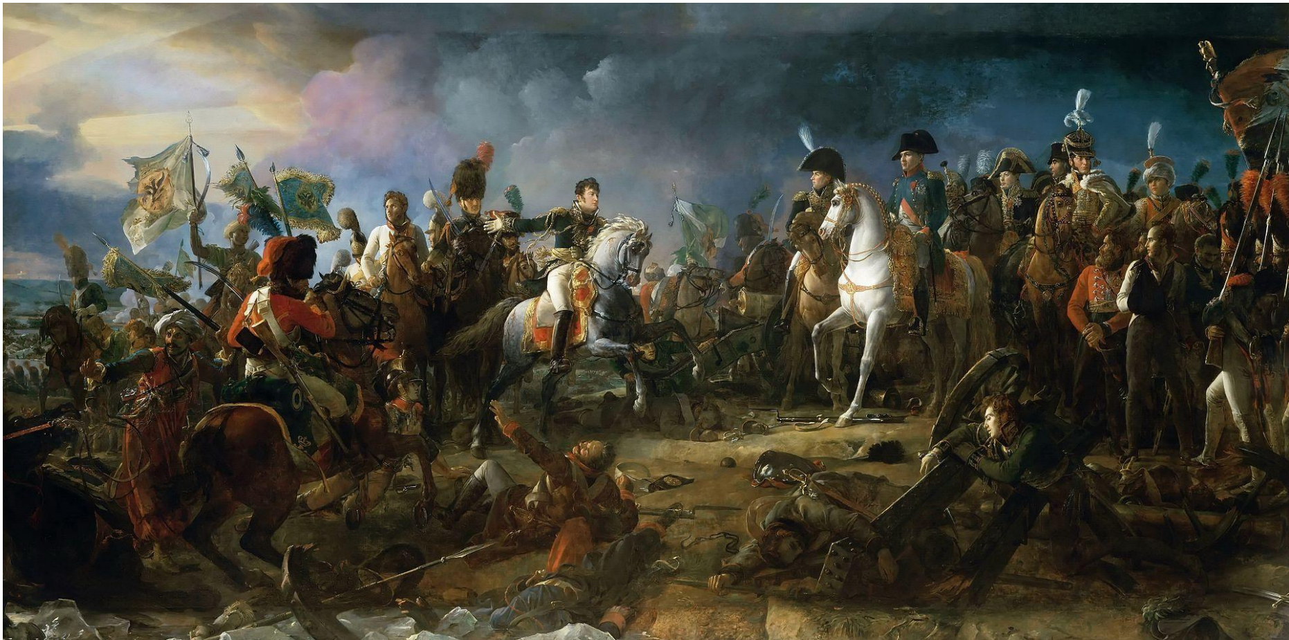
Наполеон I в битве при Аустерлице. Франсуа Жерар.