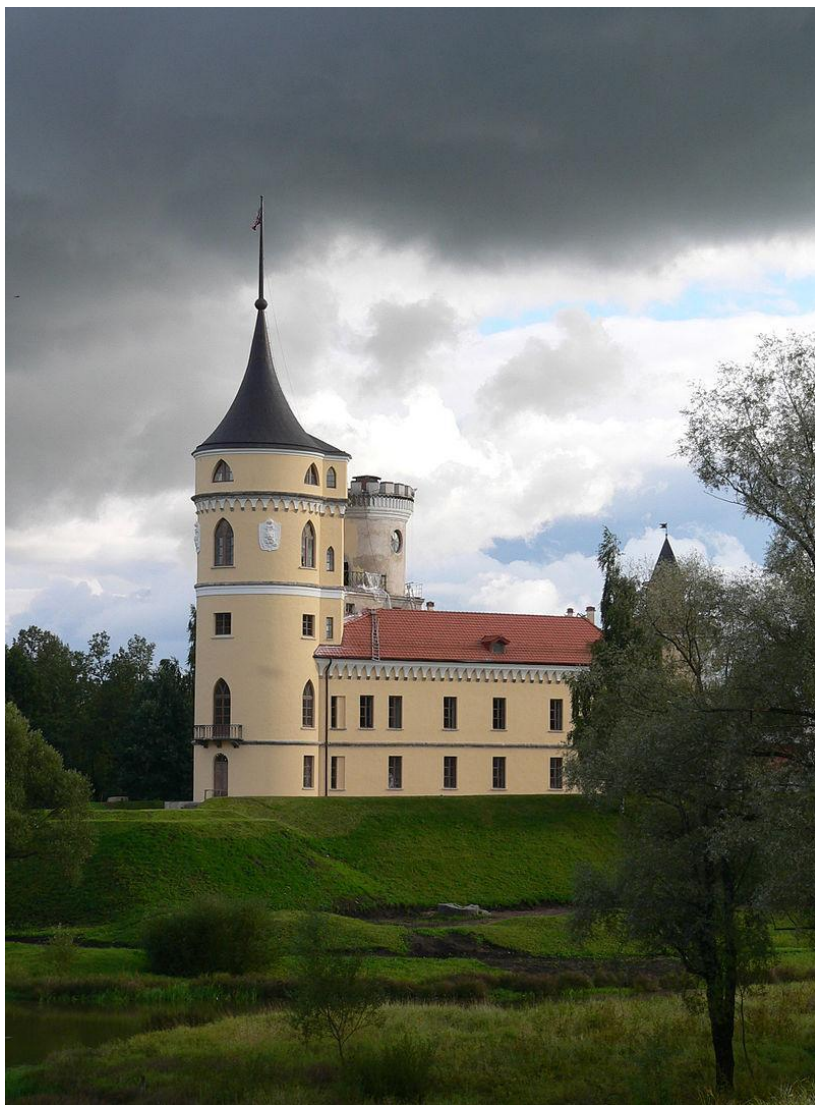
Крепость Бип на левом берегу речки Славянки — один из архитектурных капризов императора Павла