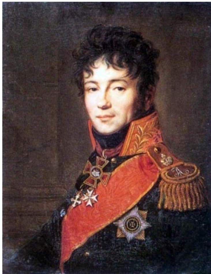
Внебрачный сын Екатерина II и Г. Орлова.

Даже участники переворота 1762 г. не понесли существенного наказания, если не считать удаления от двора и запрещения на въезд в столицы, впрочем, вскоре отмененного; А. Г. Орлов-Чесменский (по общему мнению, убийца Петра III) в течение всего царствования Павла I запросто обедал у него!