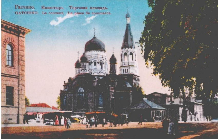
Гатчино. Монастырь. Торговая площадь. GATCHINO. Le couvent. La place de commerce.