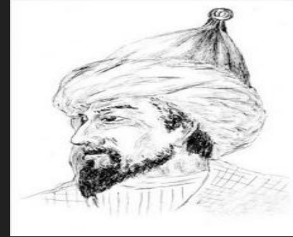
Бұрындық хан (1480-1511)