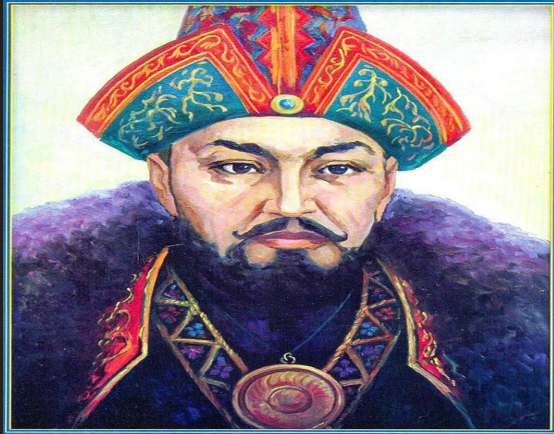
Касым хан (1445-1521)