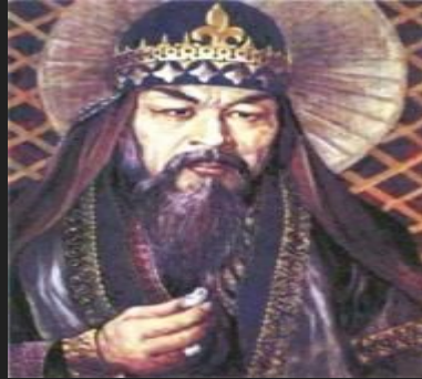
Өз-Жәнібек хан (1473-1480)