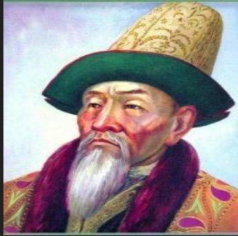
Керей хан (1456 — 1473)