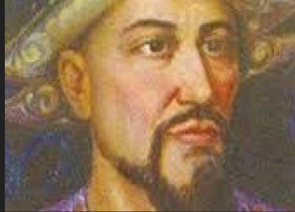
Хақ -Назар хан (1509-1580)