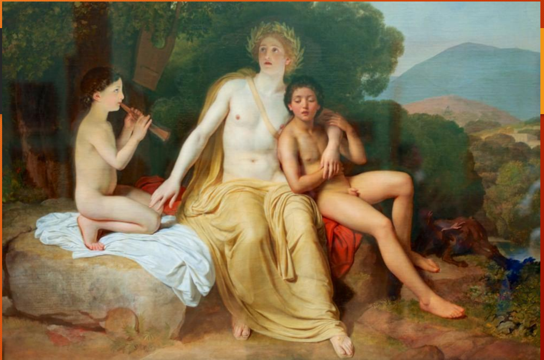
И.Иванов. Аполлон, Гиацинт и Кипарис