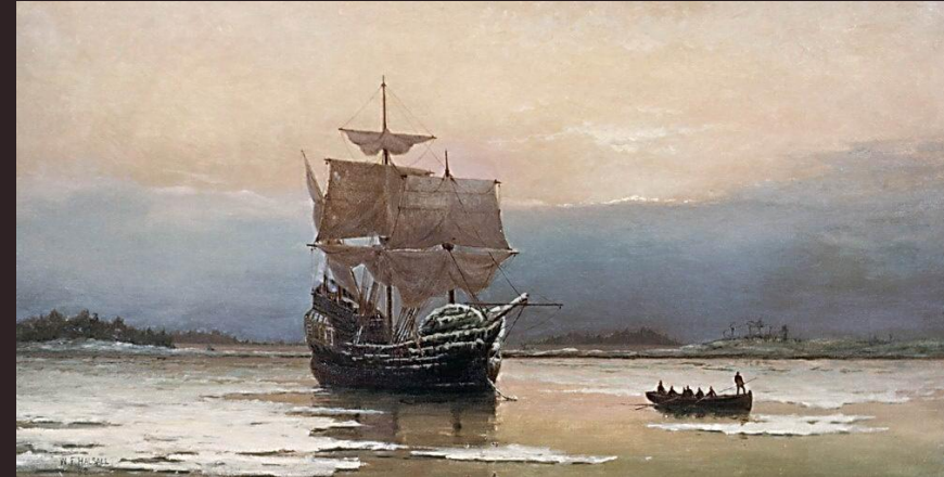
«Мэйфлауэр в гавани Плимута». Полотно Уильяма Холсалла, 1882.