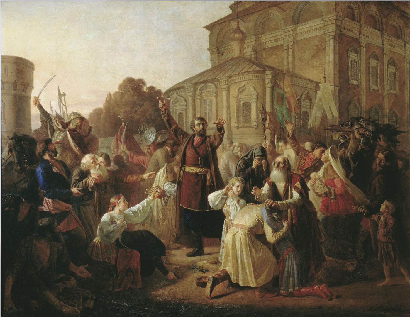
К.Минин обращается с воззванием к жителям Новгорода.