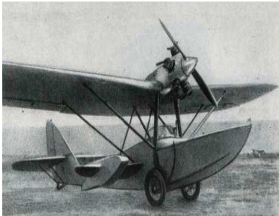
Самолет "Амфибия" учебный