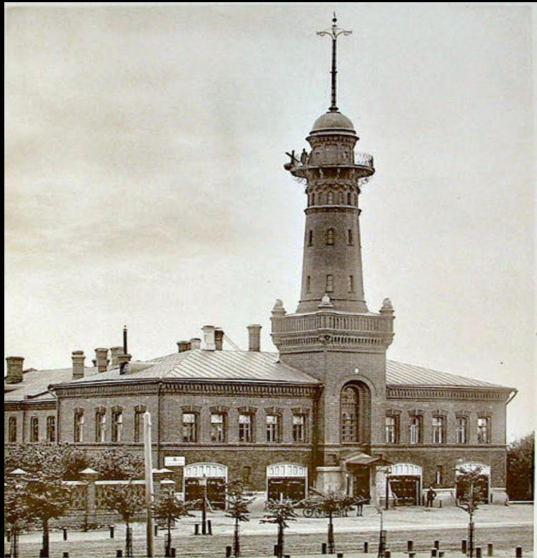
Сокольническая полицейская часть 1890 год