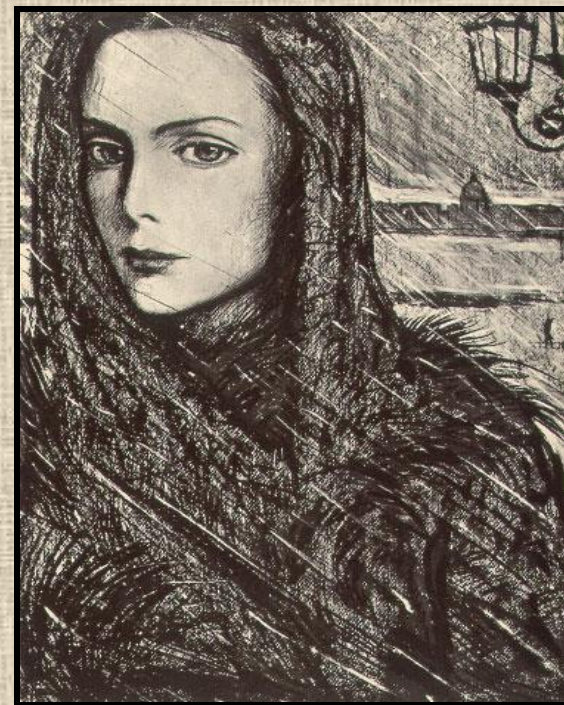
Иллюстрация И. Глазунова

Это превращение лирический герой оценит как собственное падение.