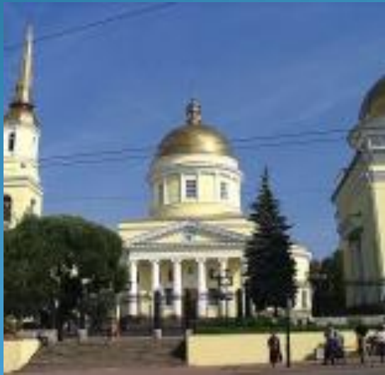
Собор Александра Невского