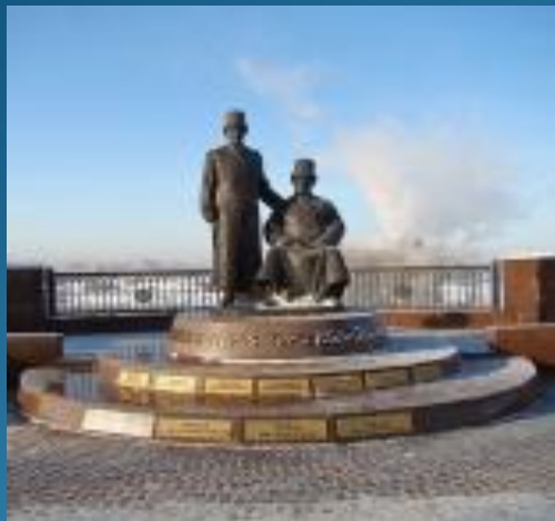
Памятник ижевским оружейникам