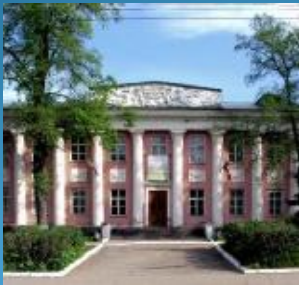
Удмуртский республиканский музей изобразительных искусств