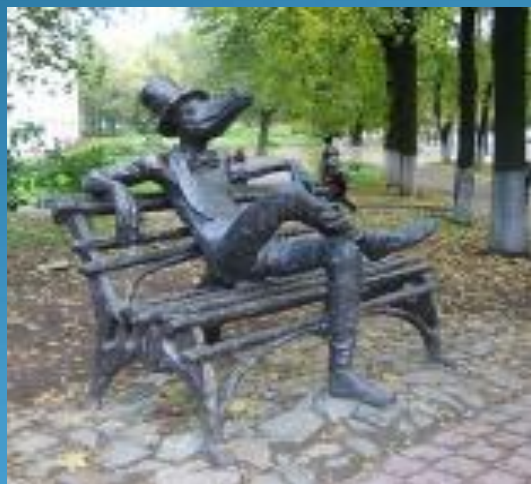
Памятник ижевскому крокодилу