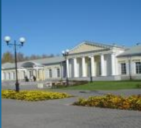
Национальный музей Удмуртской Республики им. Кузема Герда