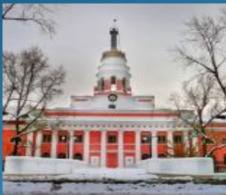
Главный корпус Ижевского оружейного завода