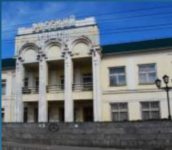
Русский драматический театр им. В.Г. Короленко