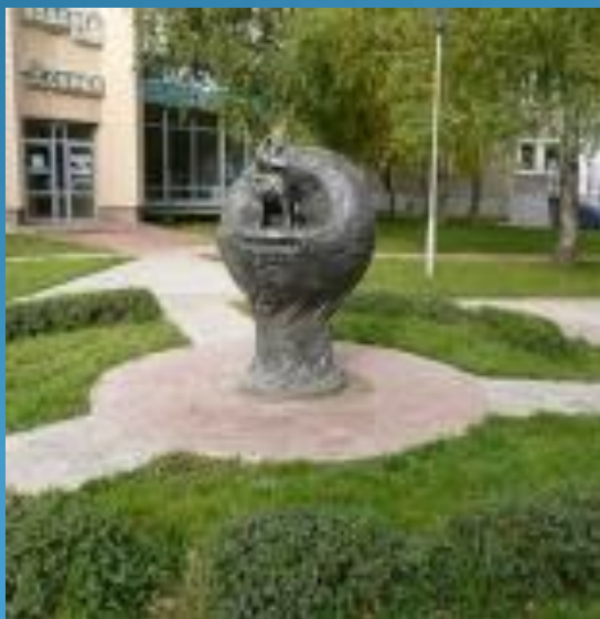
Памятник собаке-космонавту Звёздочке