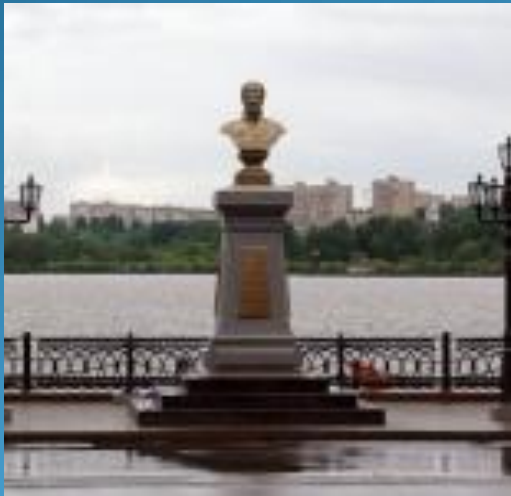
Памятник Андрею Федоровичу Дерябину