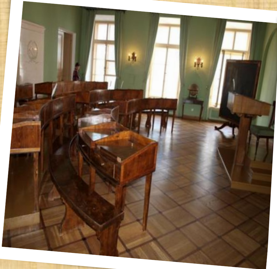
Учебный класс Царскосельского Лицея