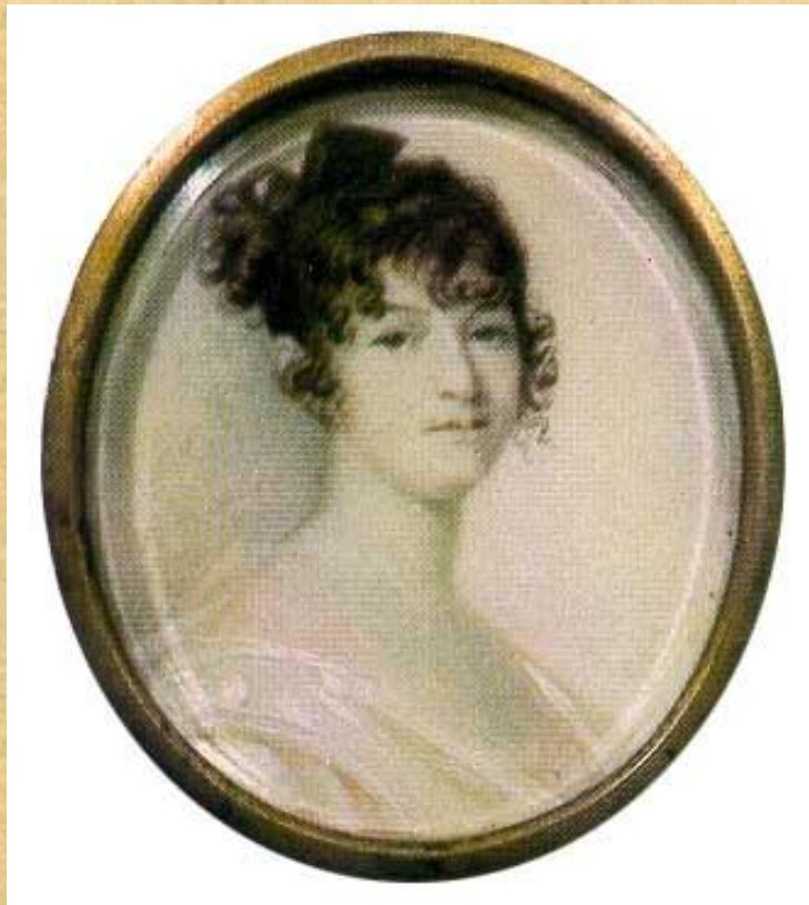
Н.О. Пушкина. 1800-е гг.

Мать, Надежда Осиповна , приходилась внучкой арапу Петра I, впоследствии русскому генералу Ганнибалу.