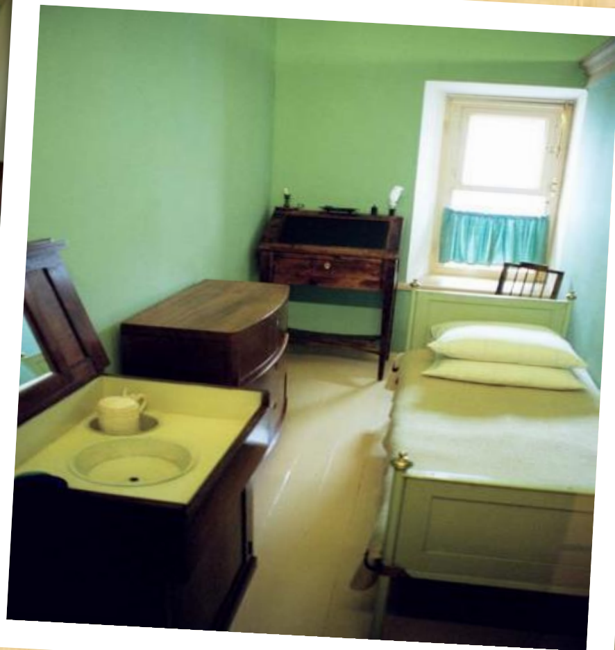
Комната лицеиста Александра Пушкина