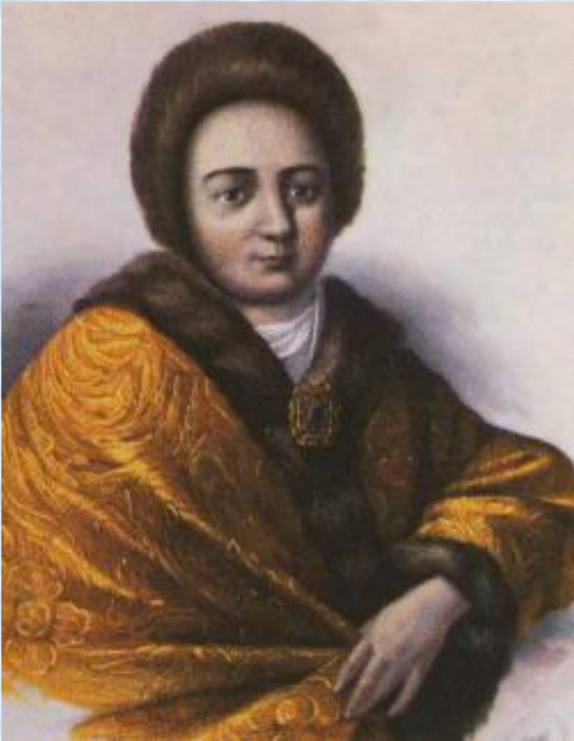
Наталья Кирилловна Нарышкина

Появилась портретная живопись – создавались парсуны