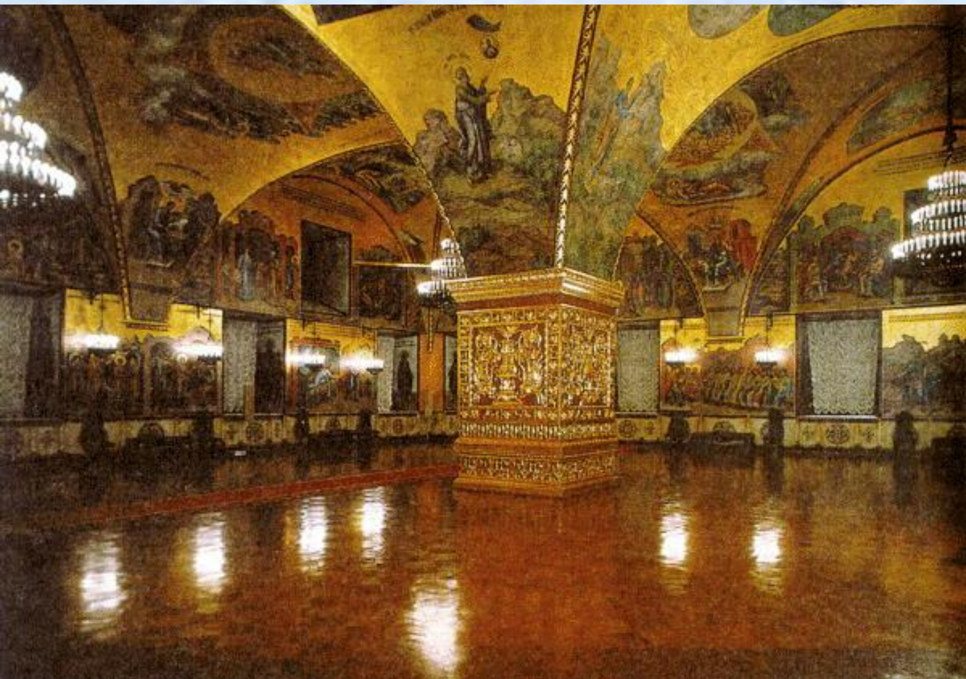
Симон Федорович Ушаков (Пимен), русский живописец и гравер.