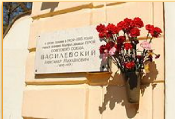
Мемориальная доска на здании Костромского государственного университета