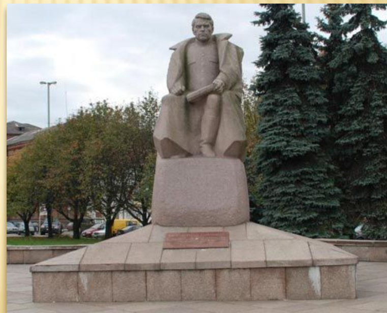
Памятник А.М. Василевскому в Калининграде