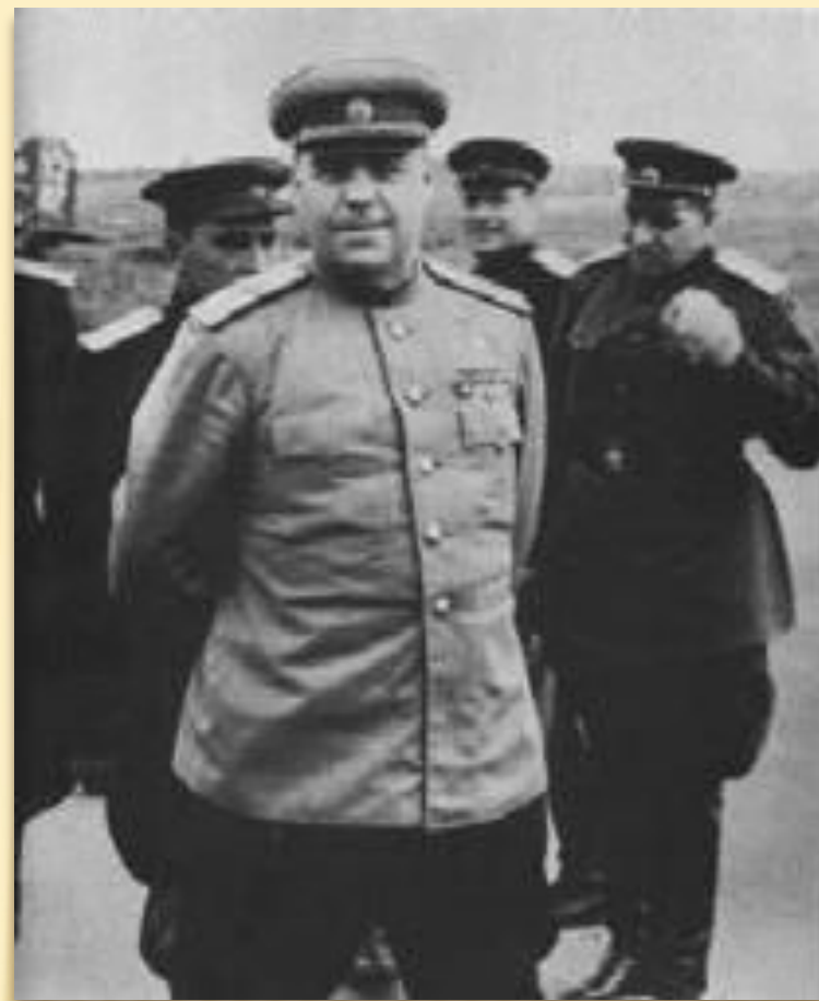
Командующий 3-м Белорусским фронтом маршал Советского Союза А.М. Василевский