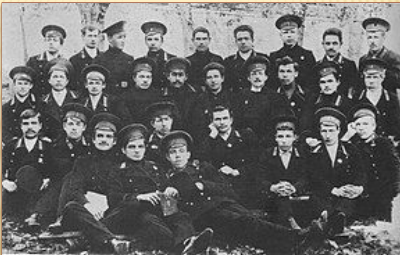
Александр Василевский (в первом ряду второй слева) среди учащихся Костромской духовной семинарии в 1914 году

Александр Михайлович Василевский — советский военачальник, Маршал Советского Союза, начальник Генерального штаба, член Ставки Верховного Главнокомандования, Главнокомандующий Главным командованием советских войск на Дальнем Востоке, Министр Вооружённых Сил СССР и Военный министр СССР. Член ЦК КПСС.