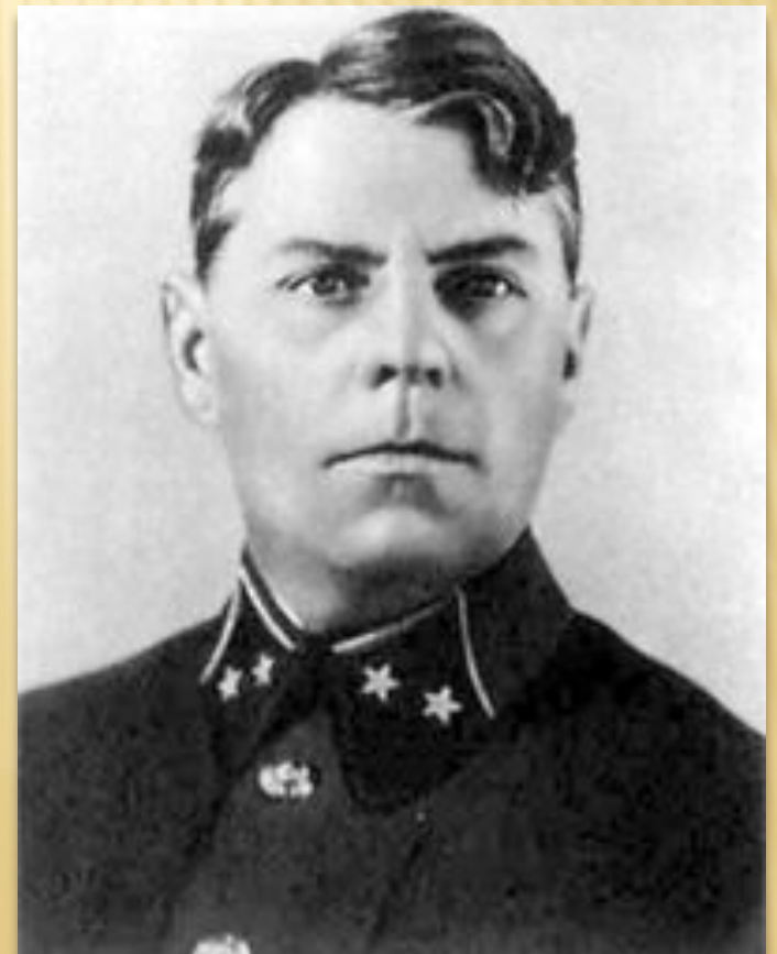
Начальник отделения оперативной подготовки Генерального штаба комбриг А.М. Василевский. 1938 год.