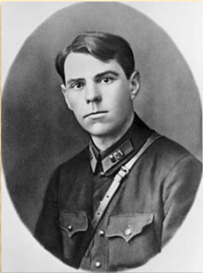
Командир полка А.М. Василевский. 1928 год