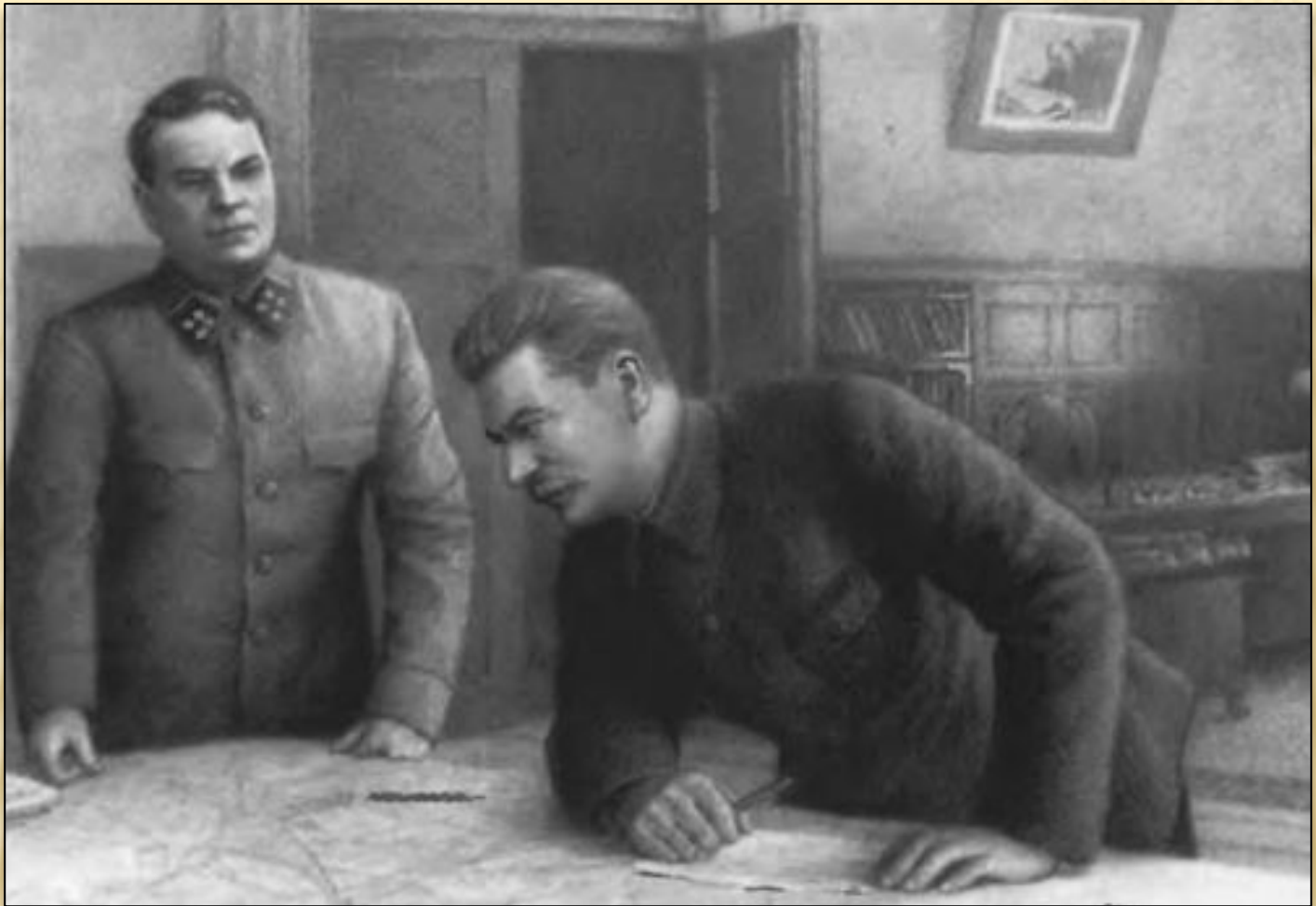
И.В. Сталин и А.М. Василевский, октябрь 1941 года