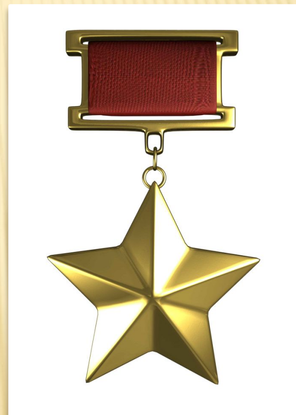
Герой Советского Союза Медаль «Золотая Звезда»