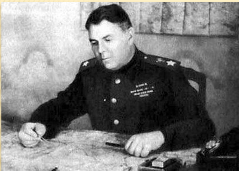
Маршал Советского Союза А. М. Василевский. Подготовка боевой операции