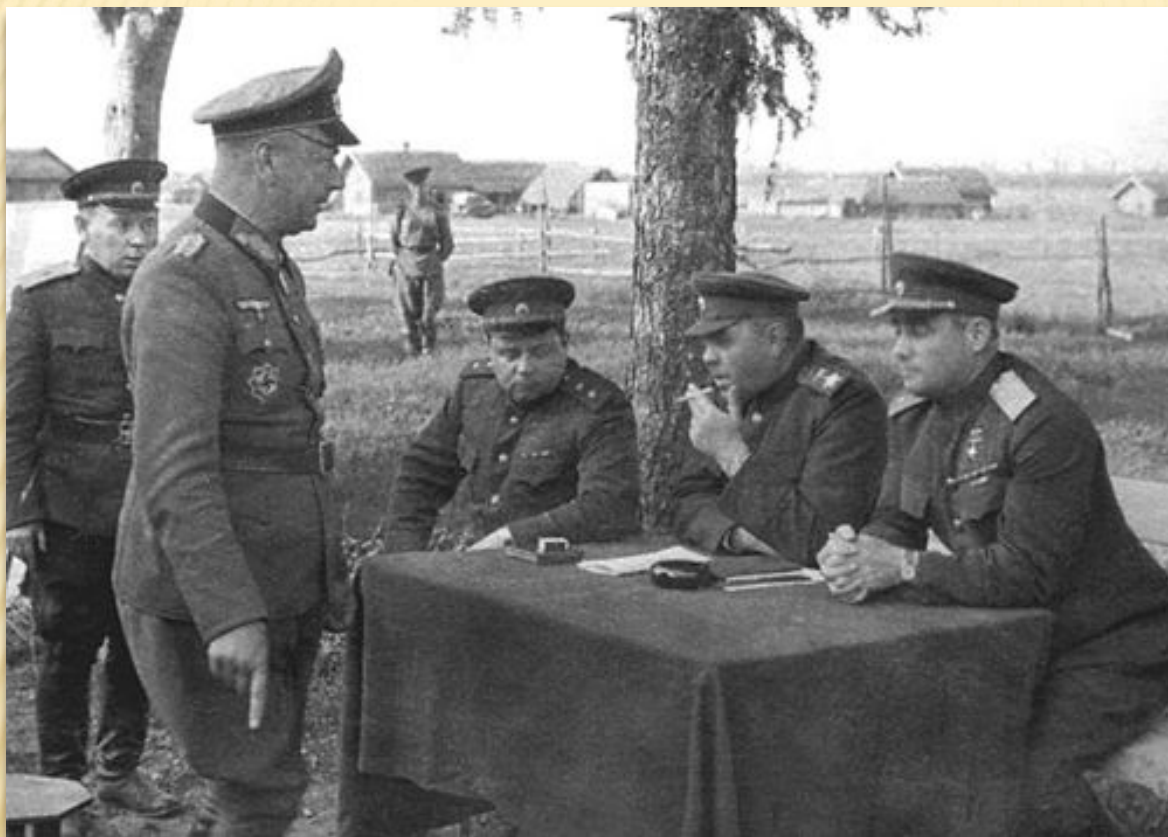
Маршал Советского Союза А.М. Василевский на 3-м Белорусском фронте. Допрос немецкого генерала. 1945 год.