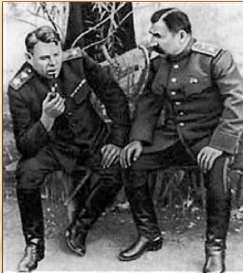
А. М. Василевский и С. М. Будённый в Донбассе, 1943 год.