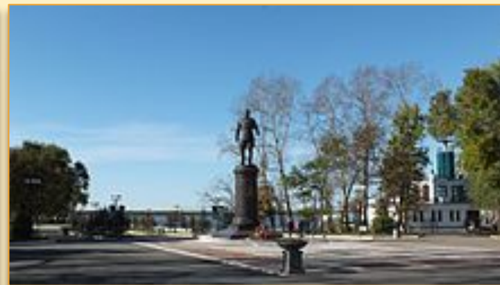
Памятник А.М. Василевскому в Хабаровске