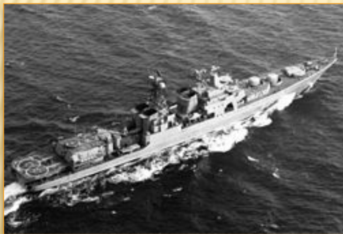
Большой противолодочный корабль «Маршал Василевский»