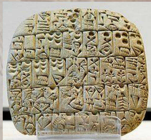
Глиняная табличка из Шуруппака. Ок 2600 г.до н.э.

По одной из гипотез, шумеры были первыми, кто создал одну из первых систем письменности в обозримой истории человечества. Этот тип назывался клинопись. Знаки выдавливались на мягкой глине, а затем табличка высушивалась. Сначала направление письма было справа на лево колонками, позже – слева на право строками. Шумеры – авторы древнейшего календаря, рецептурного справочника, библиотечного каталога. Однако, пожалуй, самым весомым вкладом древнего Шумера в мировую культуру является «Сказание о Гильгамеше» - древнейшая на земле эпическая поэма. Хаммурапи прославился как автор первого в мире свода законов.