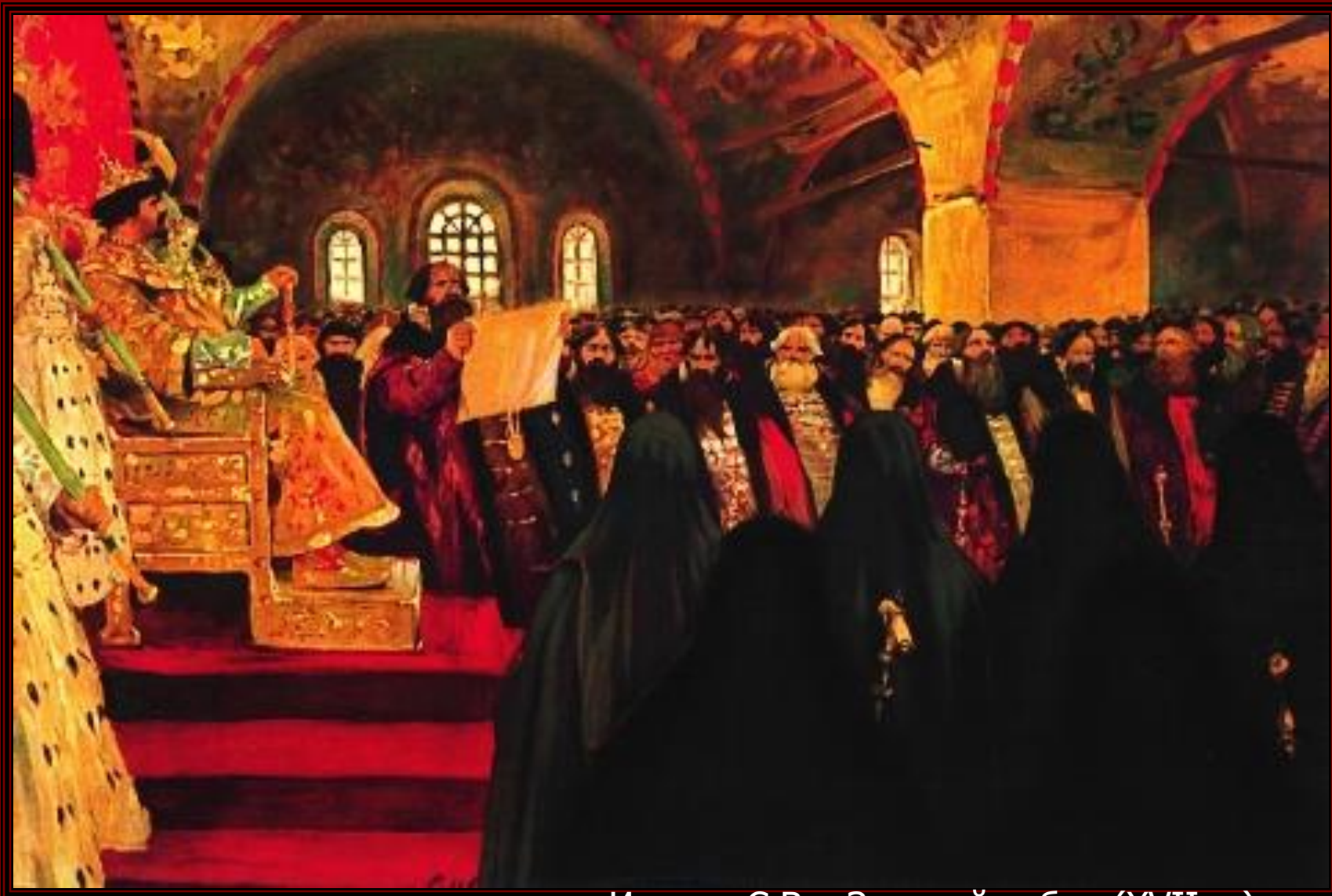
Иванов С.В. «Земский собор (XVII в.)»