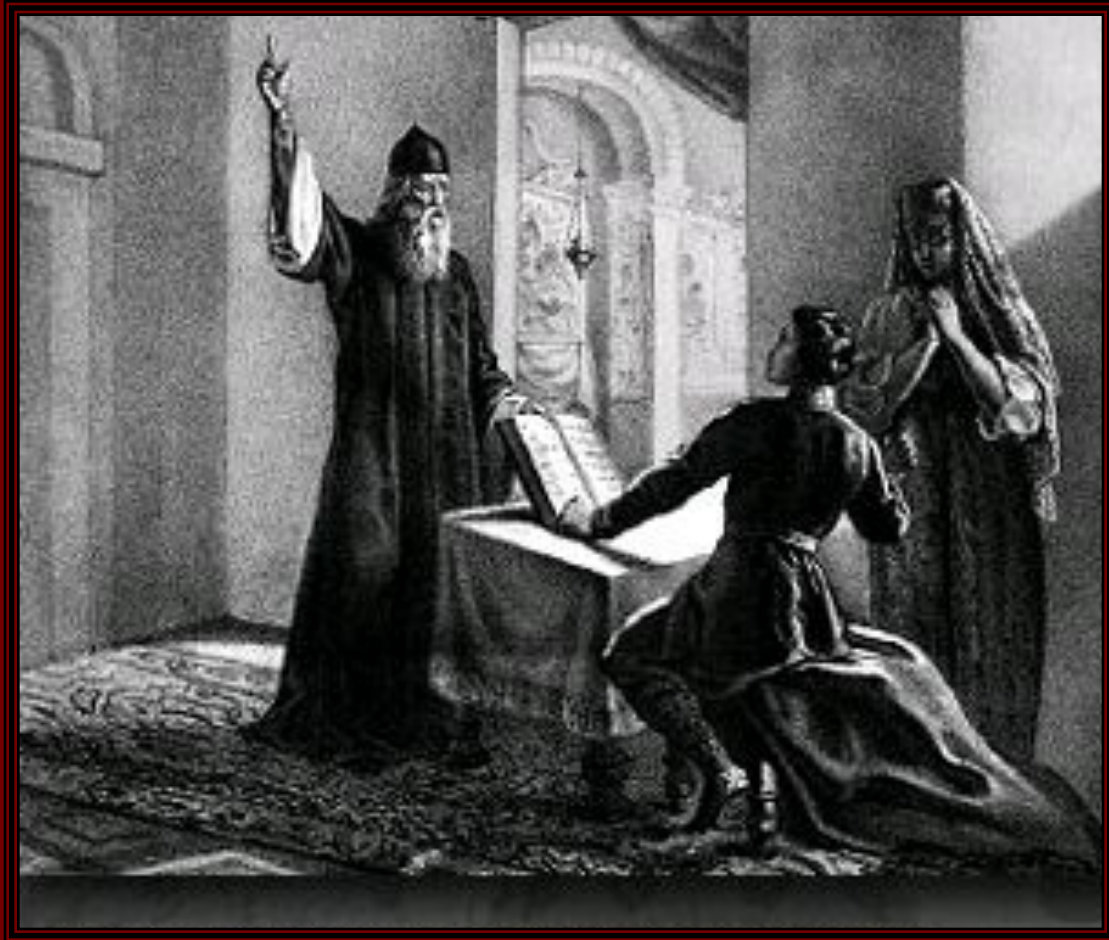
Молодой Иван Васильевич и Сильвестр.

Избранная рада – это кружок, сложившийся вокруг Ивана. В него входили: Д.Курлятаев, А.Курбский, М.Воротынский, Макарий, Сильвестр, И.Висковатый. Возглавлял раду А.Ф. Адашев.