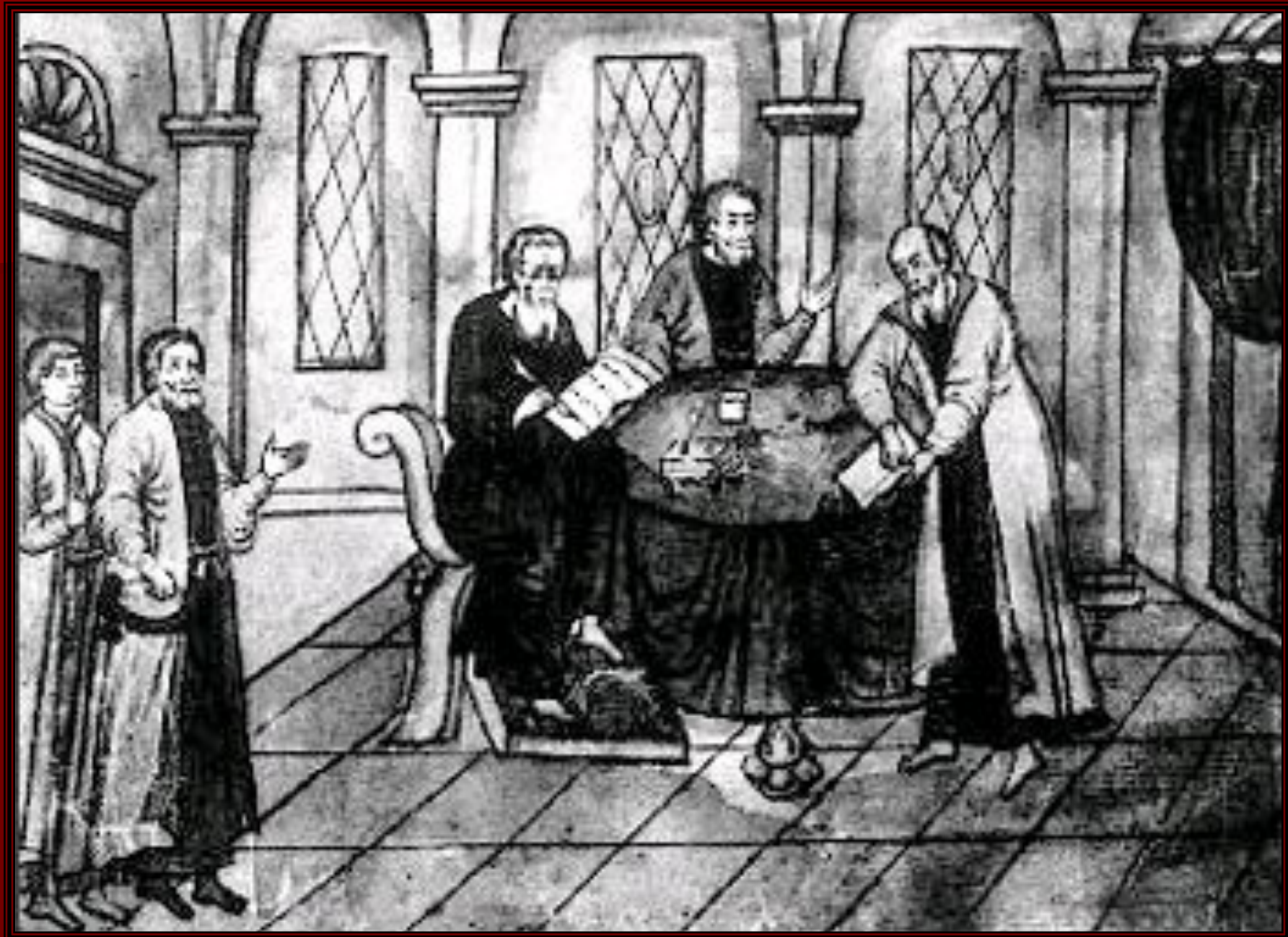
Приказные люди за работой. Рисунок из старинной рукописи.