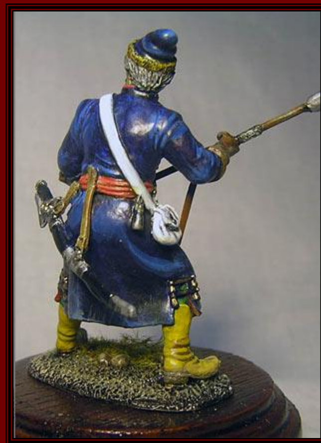
Русский стрелец времен И.Грозного