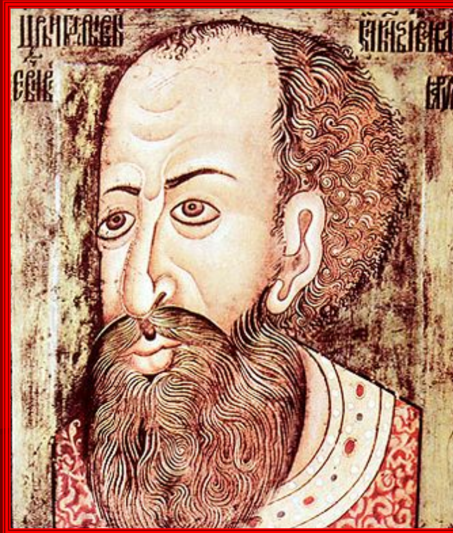
Иван IV. Парсуна. XVI век.