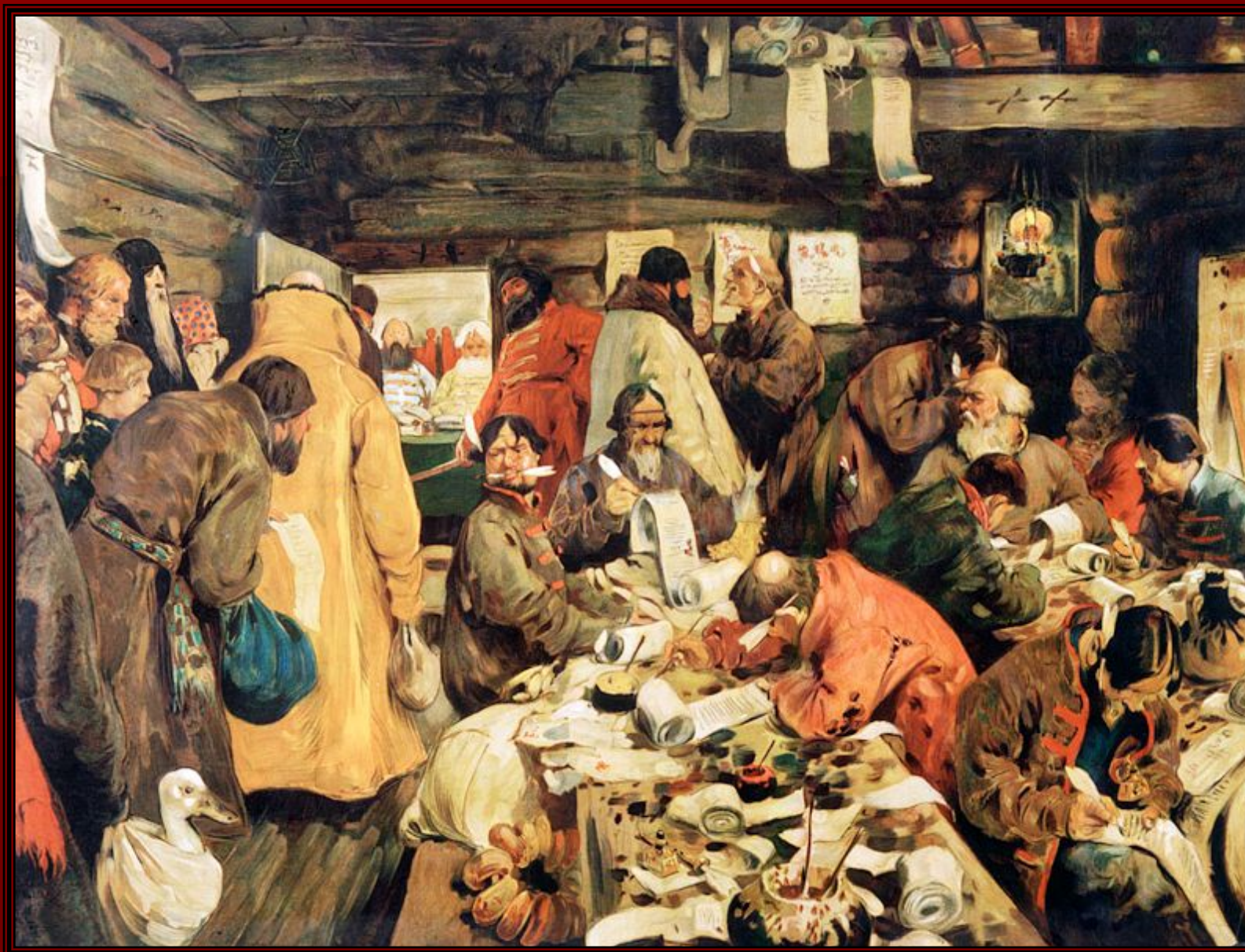
Иванов С.В. «В приказе московских времен»