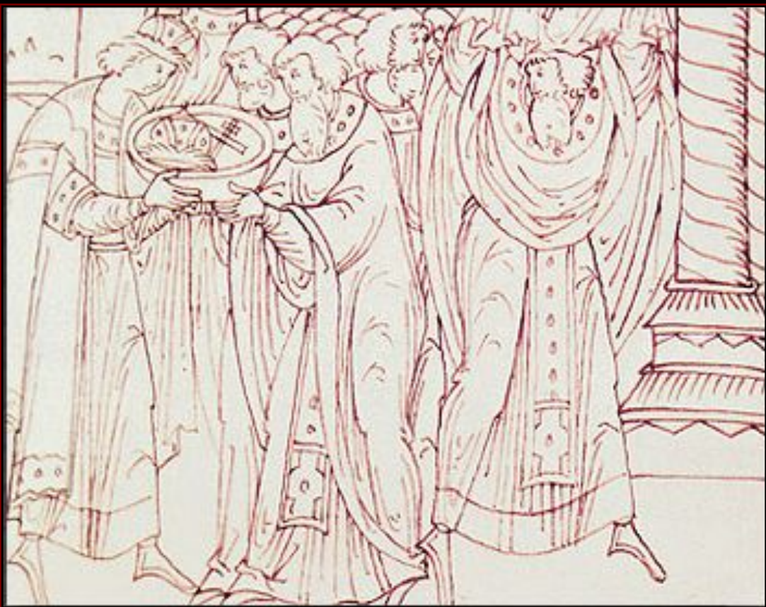
Венчание Ивана IV на царство. Миниатюра из летописи XVI в.

«Земля правиться Божиим милосердием, а последнее нами, государя своими, а не воеводы и судьи»