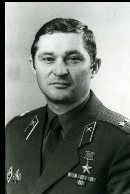
Леонид Телятников. Герой СССР

Руководство тушением пожара принял на себя майор Леонид Телятников, который получил очень высокую дозу облучения. К 4 часам утра пожар был локализован на крыше машинного зала, а к 6 часам утра потушен. При выполнении работ по тушению пожара и предотвращению взрыва многие получили большие дозы радиации, часто смертельные. В промежутке 1986—1992 годов 600 000 ликвидаторов и более миллиона людей из разных областей и республик тогдашнего СССР было задействовано в работах в 30-километровой зоне.