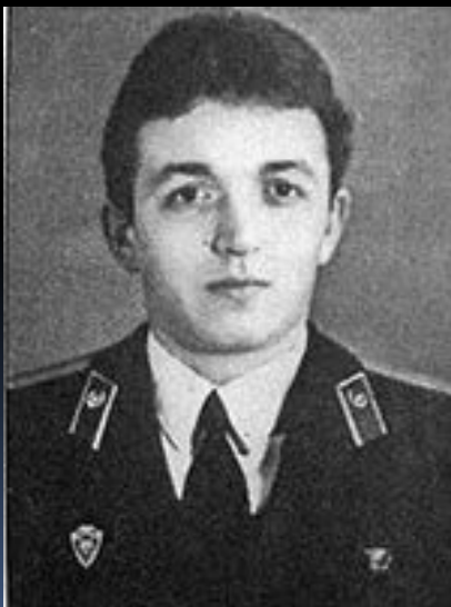
Виктор Николаевич Кибенок. Герой СССР

Масштабы катастрофы могли быть больше, если бы не мужество и самоотверженность участников ликвидации последствий аварии на Чернобыльской АЭС.