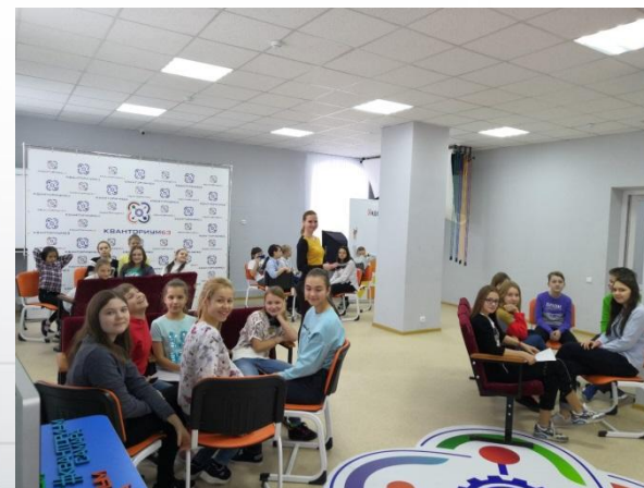
Что? Где? Когда?