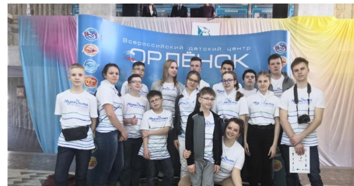
Поездка в ВДЦ «Орленок» Фестиваль «Медиа-Волна»