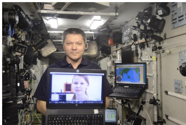
Поздравление с Днем космонавтики на МКС