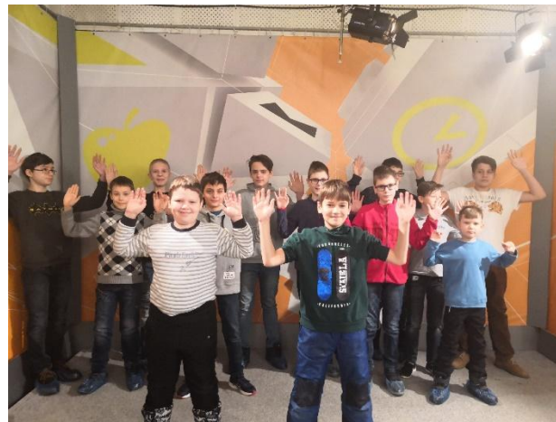
Экскурсия на ТРК СКАТ