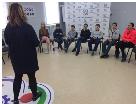
Тренинг по ораторскому мастерству