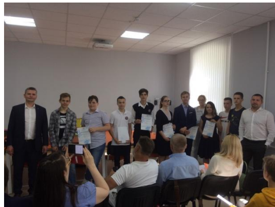
Конкурс на лучший кванторианский проект