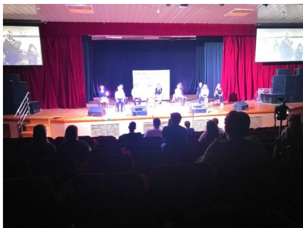
Военный спектакль «Письма»