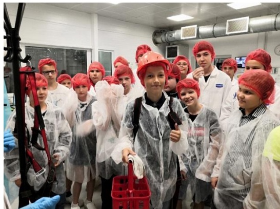
Экскурсия на завод «Данон»