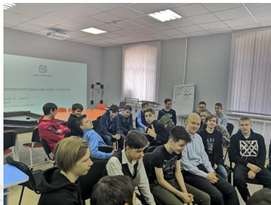
Интеллектуальная игра о спорте