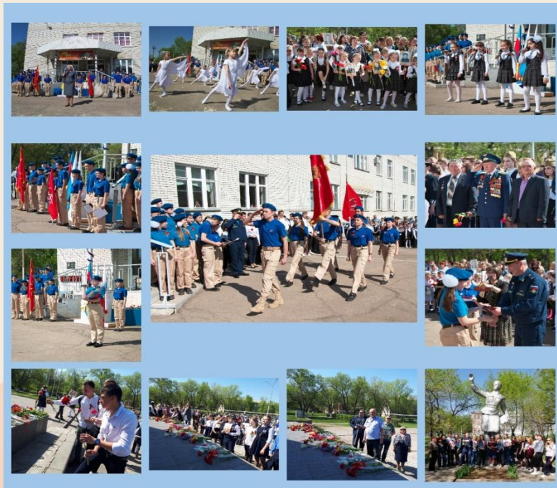
Торжественная линейка, посвященная Дню Победы, торжественная церемония приема в юнармейцы (Саратовская область, г.Энгельс)