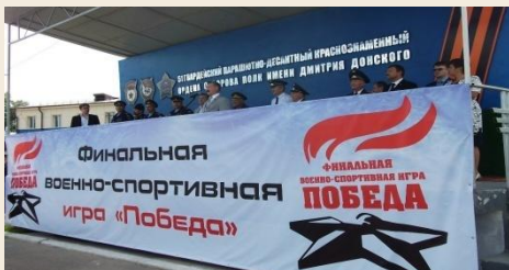
Всероссийские молодежные военно-патриотические игры, олимпиады, конкурсы