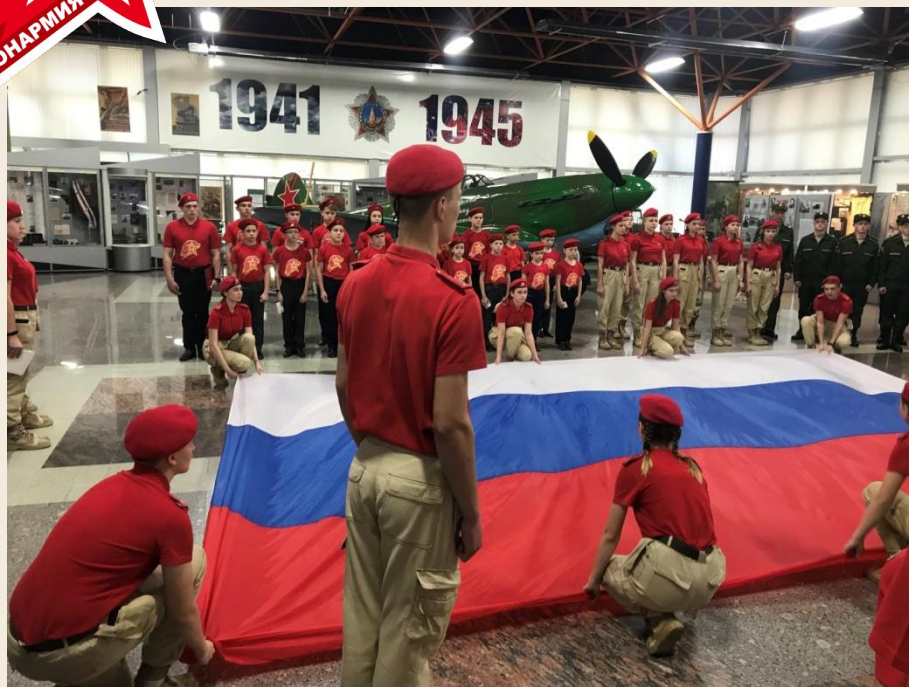
Торжественная церемония приема в юнармейцы (Музейно-мемориальный комплекс «Соколова гора», г. Саратов)