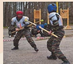
Всероссийские молодежные спартакиады по военно-прикладным видам спорта, сдача норм ГТО

Формы работы используемые движением, помогут молодежи в самореализации, овладении первоначальными навыками военной подготовки, физическом совершенствовании, изучении и сохранении военной истории России