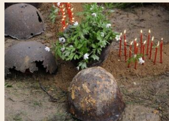
Детско-юношеские поисковые отряды