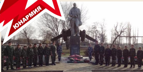
Профильные специализированные формирования юнармейцев (юных летчиков, моряков, десантников, танкистов, и другие)