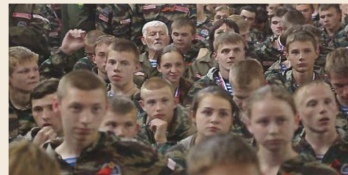
Детско-юношеские военно-патриотические, военно-исторические клубы