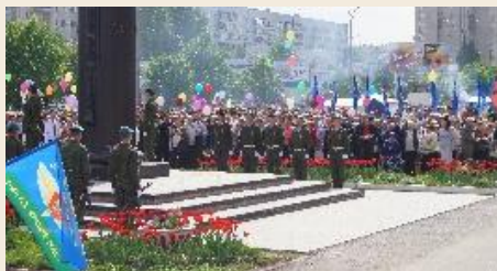
Юнармейские посты у Вечного огня, обелисков, мемориалов, участие в воинских ритуалах