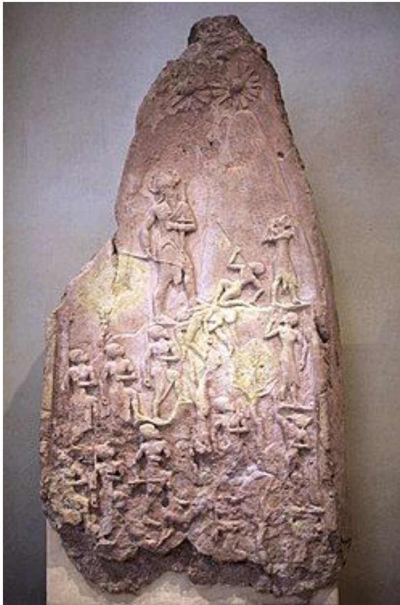
Победная стела Нарам-Суена. Обнаружена в Сузах. В настоящее время хранится в Лувре