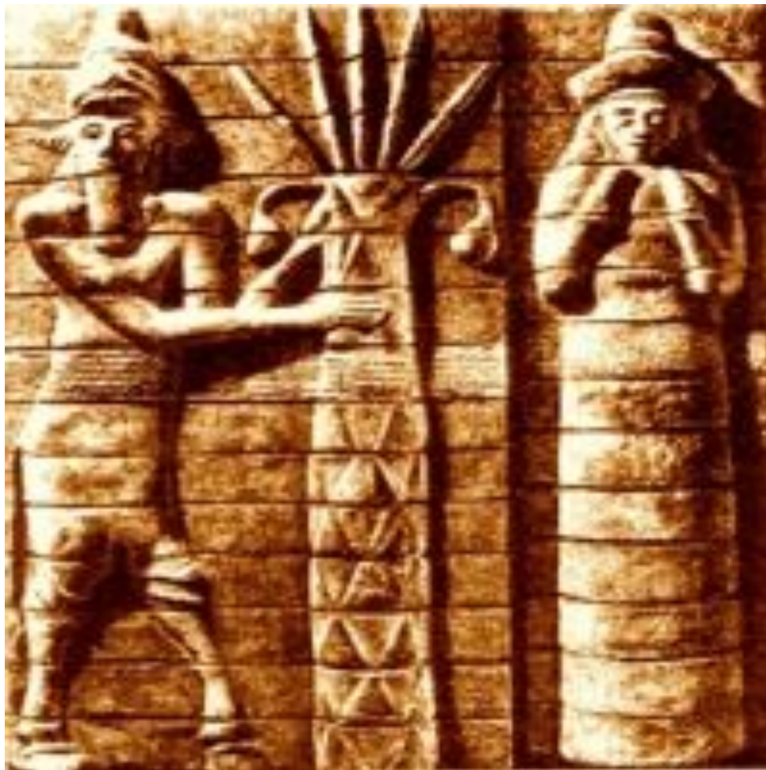
Лугальбанда и Энмеркар, рельеф