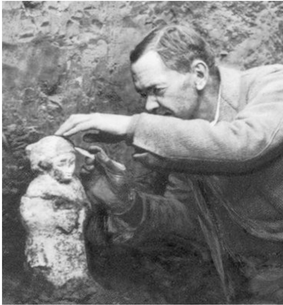
Чарлз Леонард Вулли на раскопках