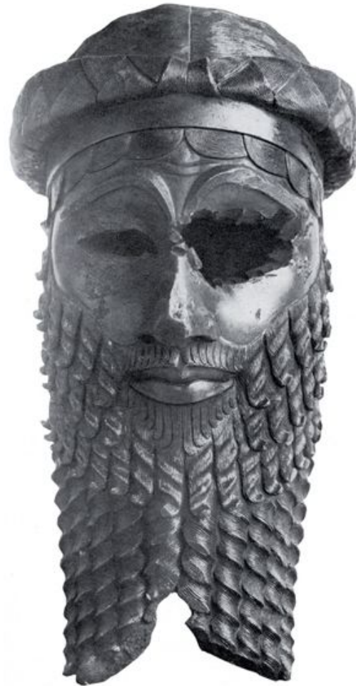
«Маска Саргона» (ок. 2300 г. до н. э.), обнаруженная в Ниневии при раскопках храма Иштар