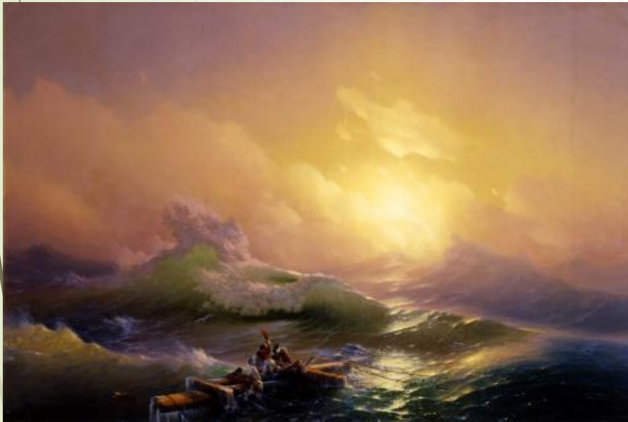
Н. Айвазовский. Девятый вал. Морской берег.