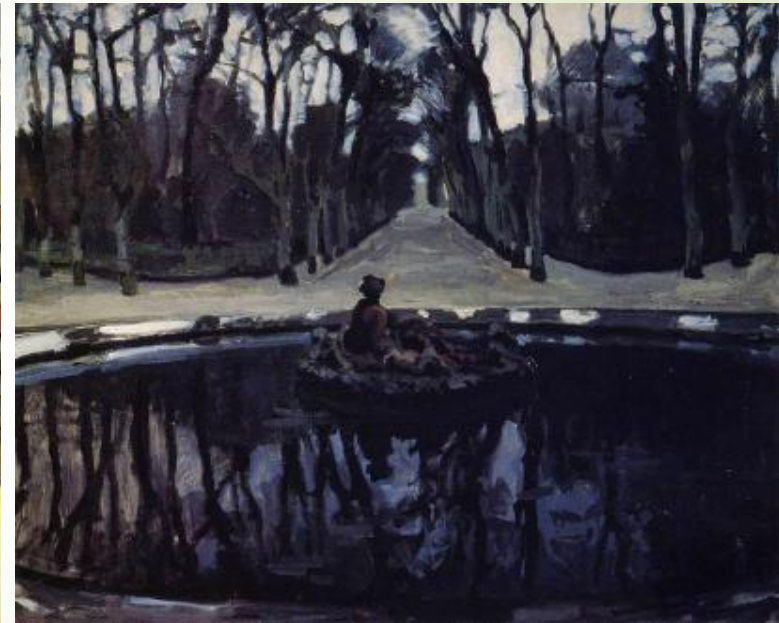
Александр Бенуа «Прогулки короля Людовика по парку»