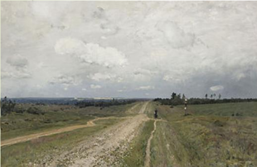
И. И. Левитан. Владимирка.,