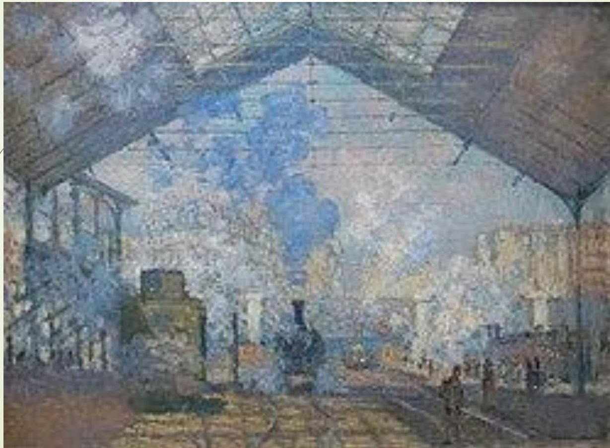
Клод Моне. Вокзал Сен-Лазар