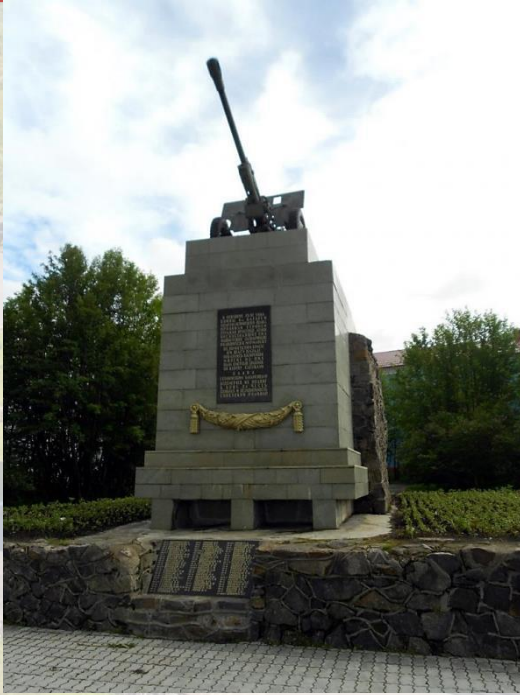
ПАМЯТНИК ВОИНАМ 6 ГЕРОИЧЕСКОЙ КОМСОМОЛЬСКОЙ БАТАРЕИ