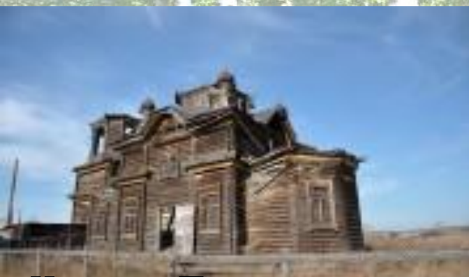
«Церковь Покрова Пресвятой богородице»