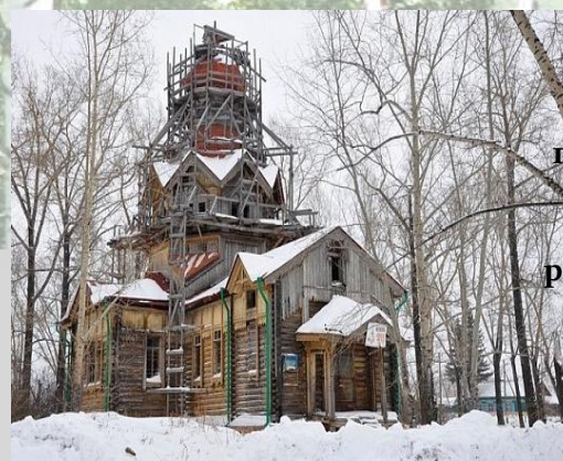
Церковь построена во имя святой равноапост ольной княгини Ольги.