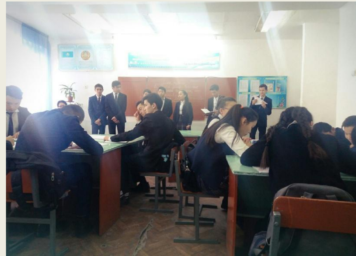
9 “А” сыныбы Әділ Әйнел “” тақырыбында ашық сабақ