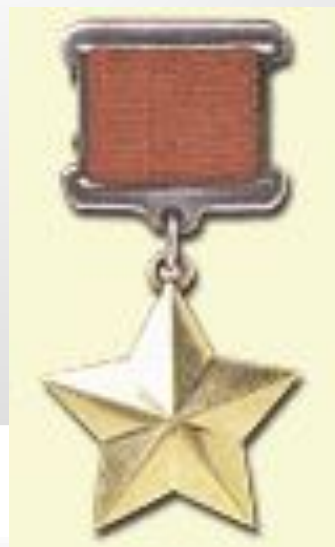
Медаль "Золотая Звезда"