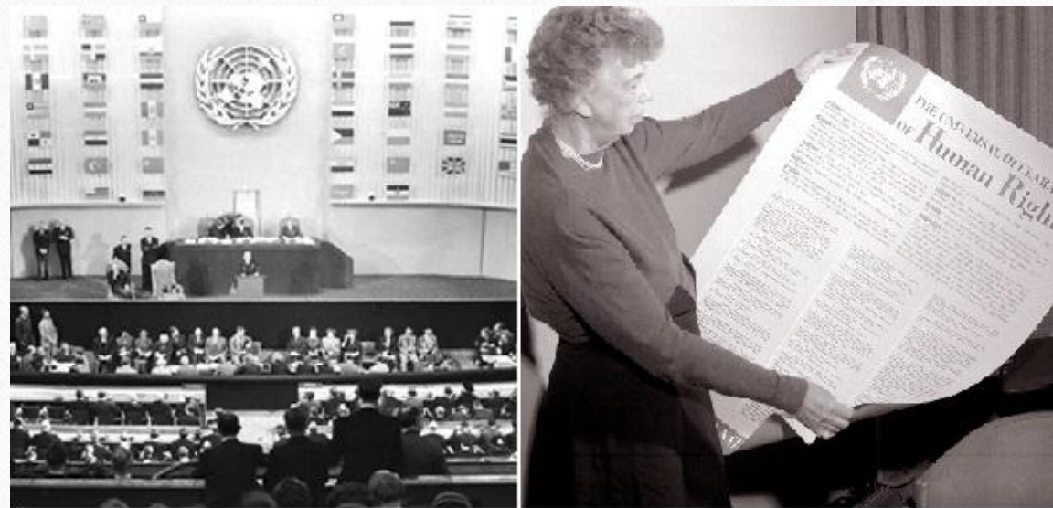
Генеральная Ассамблея ООН, 1948 год Элеонора Рузвельт с текстом декларации

Всеобщая декларация прав человека и гражданина (1948 г.) устанавливает важнейшее право человека и гражданина выразить свою волю посредством выборов (ч. 3 ст. 21): «Воля народа должна быть основой власти правительства: эта воля должна находить себе выражение в периодических и нефальсифицированных выборах, которые должны проводиться при всеобщем и равном избирательном праве, путем тайного голосования или же посредством других равнозначных форм, обеспечивающих свободу голосования».