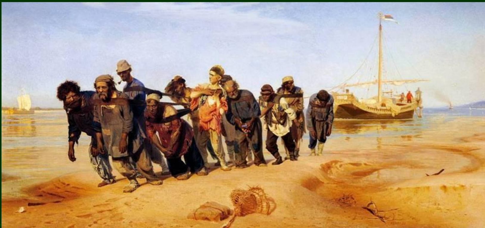
Илья Репин «Бурлаки на Волге» (1870—1873 года)

Красота местных пейзажей не раз оказывалась запечатлённой на холстах художников. Иван Айвазовский в середине 1880-х годов путешествовал по Волге на пароходе, а через несколько лет создал картину «Волга у Жигулевских гор» (1887). Илья Репин в 1870 году отдыхал в селе Ширяево и работал над этюдами к картине «Бурлаки на Волге» (1870—1873). Сейчас в этом селе открыт его дом-музей. Вместе с Репиным в Ширяево работал русский пейзажист Федор Васильев. Результатом этой летней поездки стала одна из самых известных его картин «Вид на Волге. Барки» (1870).