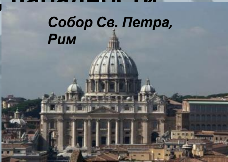
Собор Св. Петра, Рим