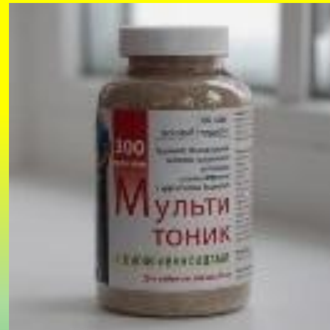
Мультитоник «Дигидрокверцетин» 50+