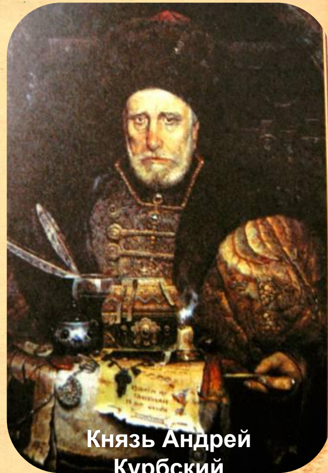
Князь Андрей Курбский