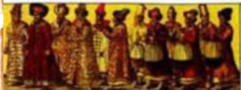
Русское посольство к германскому императору