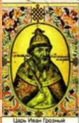
Царь Иван Грозный