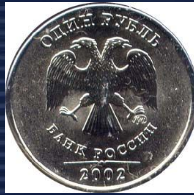
«орел» - обратная сторона монеты (реверс)