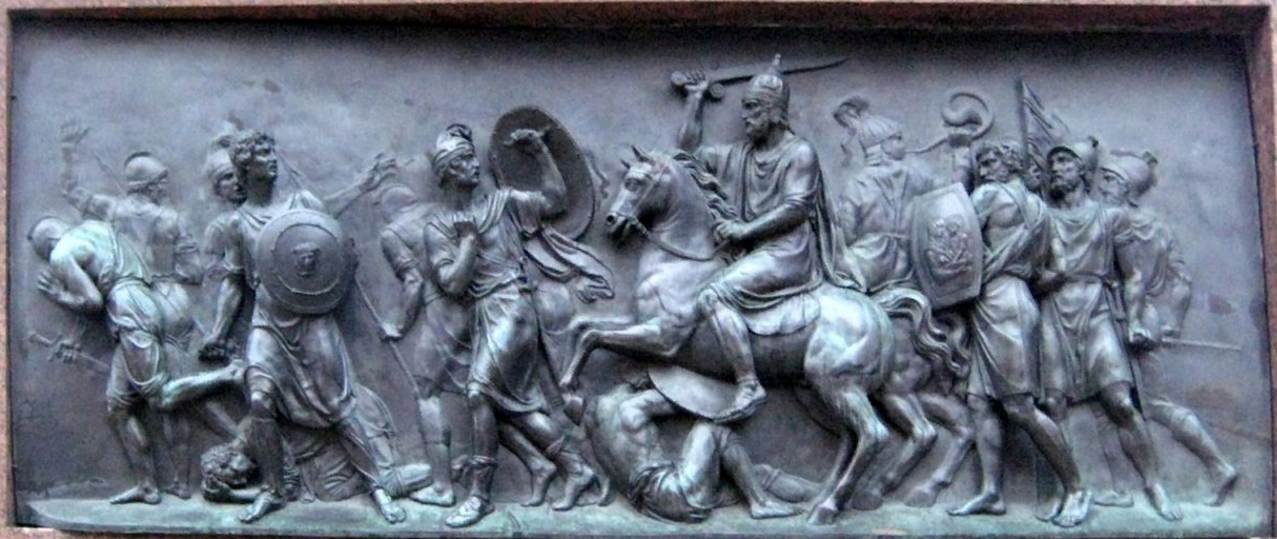
Барельеф с памятника Минину и Пожарскому.

Вы узнаете из нашей презентации. Ну что, начали?