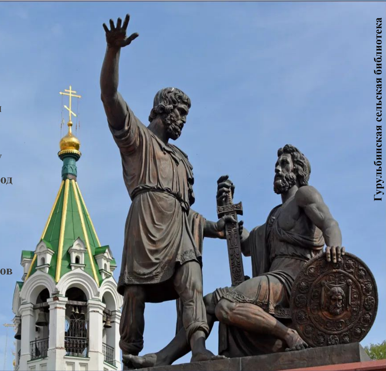
Памятник Минину и Пожарскому в Нижнем Новгороде

4 ноября граждане России отмечают государственный праздник - День народного единства. История этого дня уходит корнями в 1612 год. Именно 4 ноября (по новому стилю) народное ополчение под предводительством Кузьмы Минина и Дмитрия Пожарского выдворило из столицы польских интервентов (захватчиков). Впервые мы отметили этот праздник 4 ноября 2005 года.