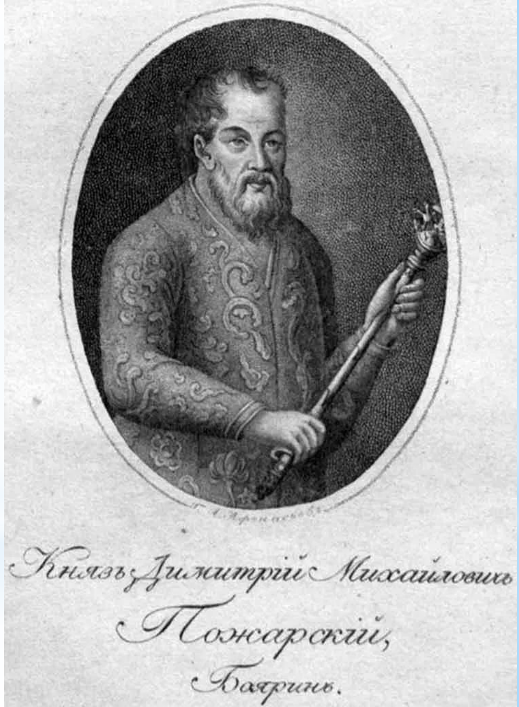
Князь Дмитрий Михайлович Пожарский, Бояринь.

И вскоре с ним встретились посланцы Кузьмы Минина и уговорили возглавить Второе ополчение.