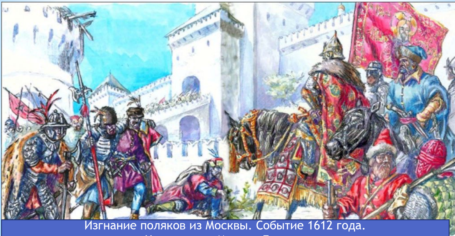
Изгнание поляков из Москвы. Событие 1612 года.