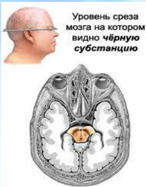
Уровень среза мозга на котором видно чёрную субстанцию