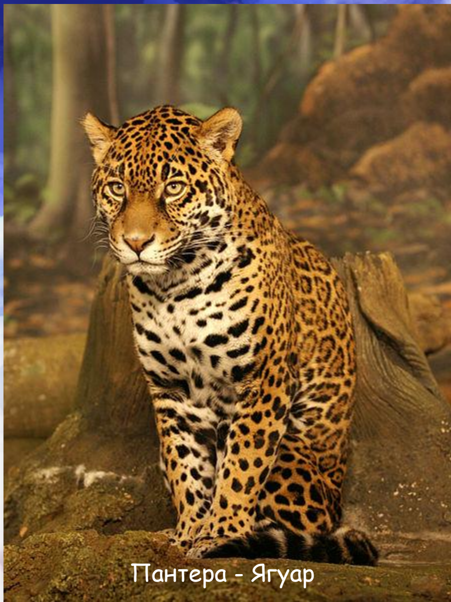
Пантера - Ягуар