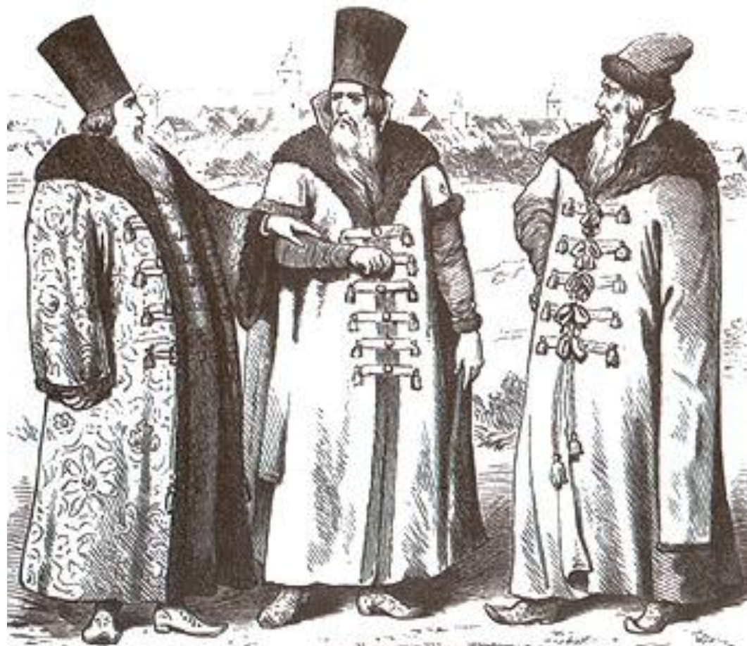
Русские бояре XVI-XVII вв.