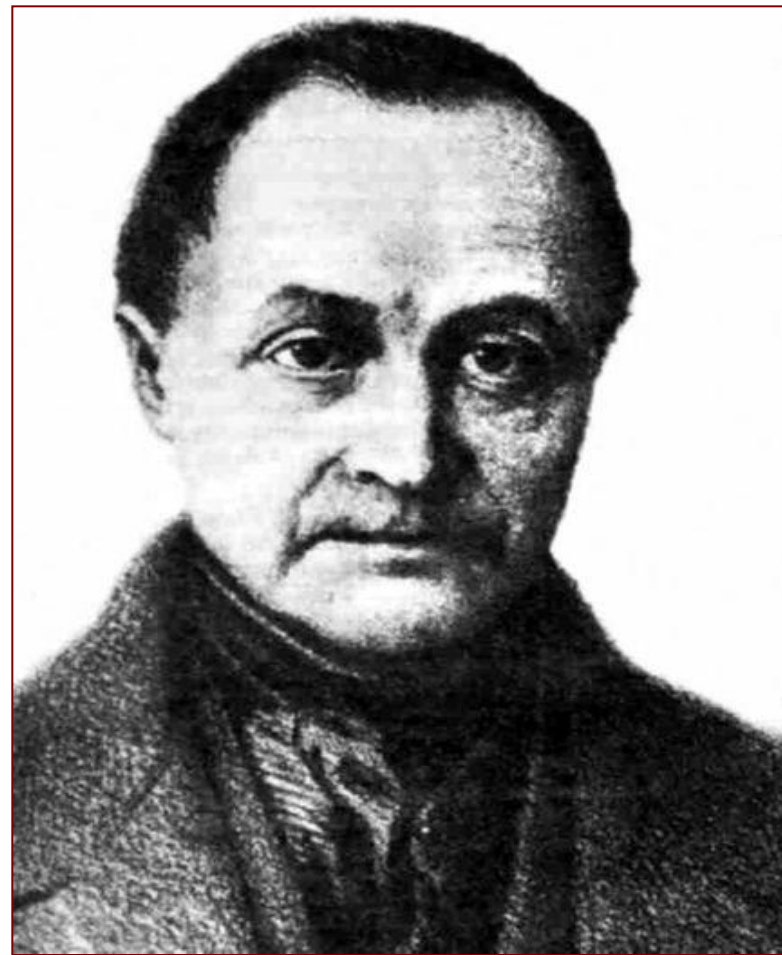
Огюст Конт (1798—1851)