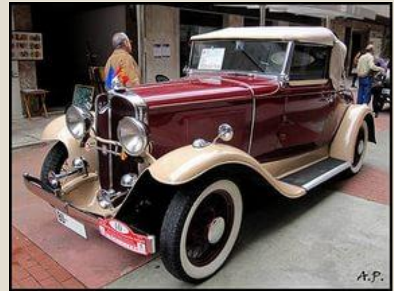
1930 Pontiac Roadster.