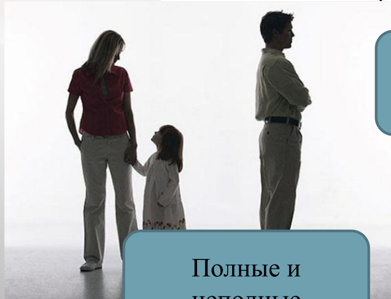
Полные и неполные