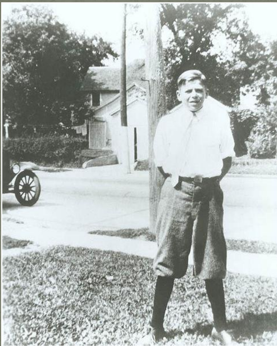
Рональд Рейган, юность в Диксоне