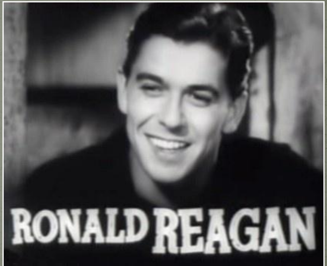
Рейган в фильме Ковбой из Бруклина в 1938 году