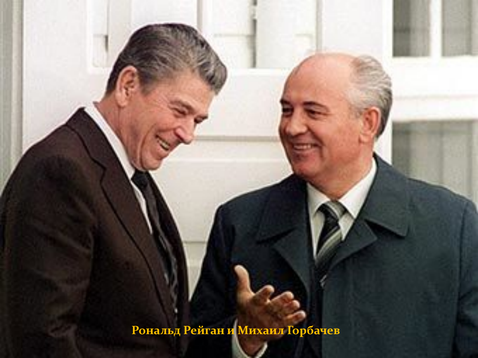
Роналд Рейган и Михаил Горбачев