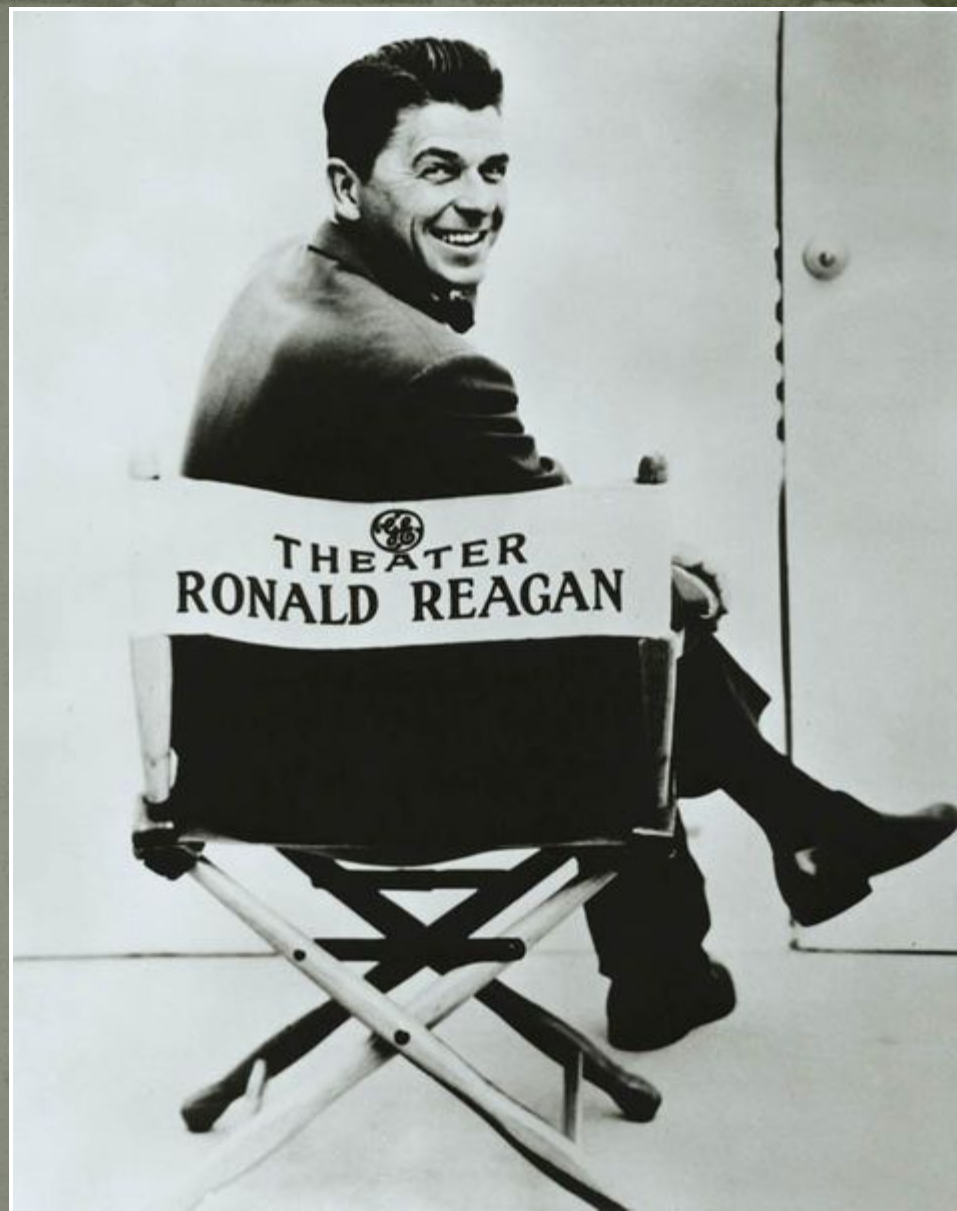
Звезда телевидения Рональд Рейган, ведущий Театра Дженерал Электрик