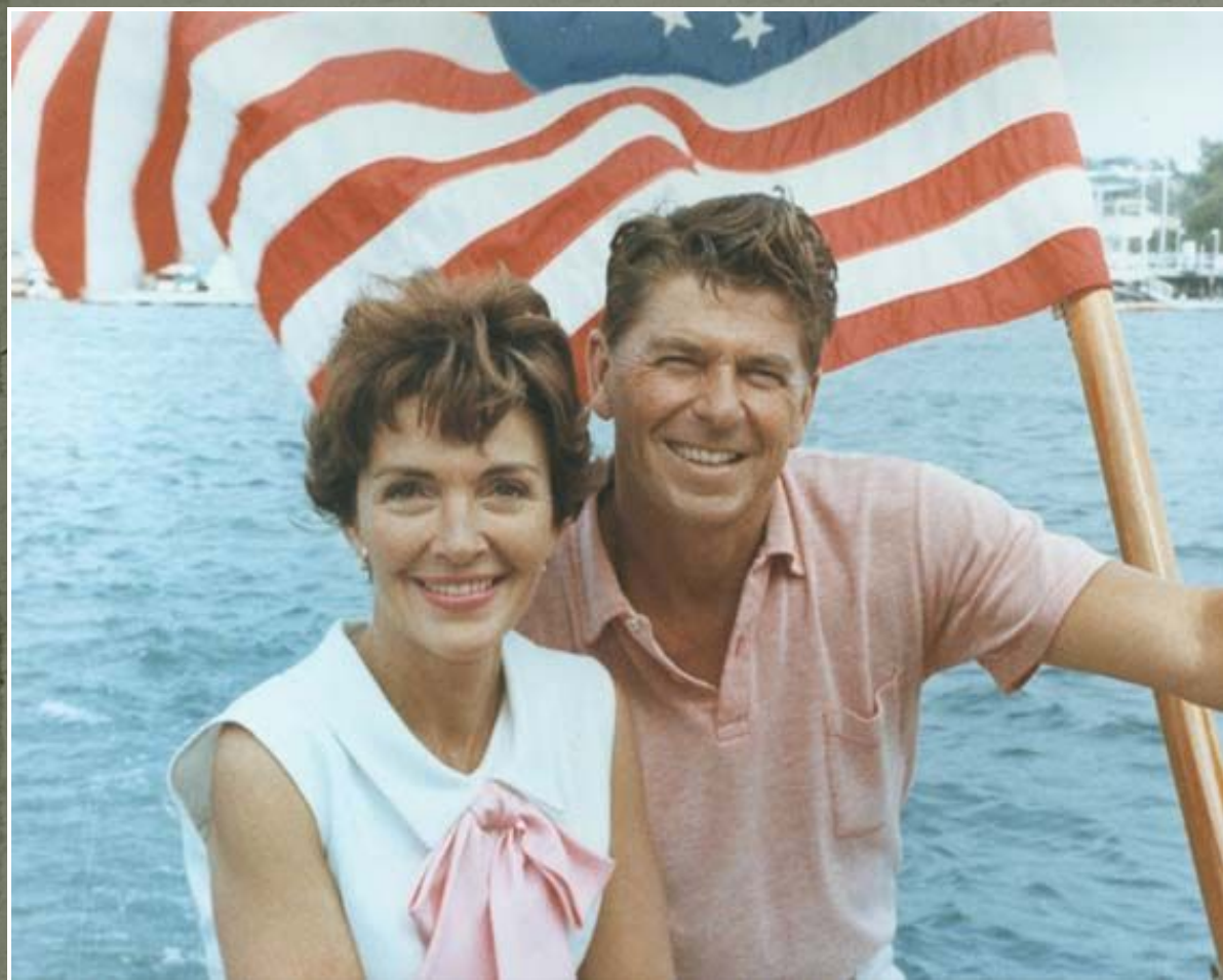
Нэнси и Рональд на катере в 1964

В 1938 году Рейган снимался в фильме Brother Rat вместе с актрисой Джейн Уайман. Помолвка состоялась в театре «Чикаго», венчались 26 января 1940 г. в церкви в городе Форест-Лон, штат Калифорния. У них было двое детей.