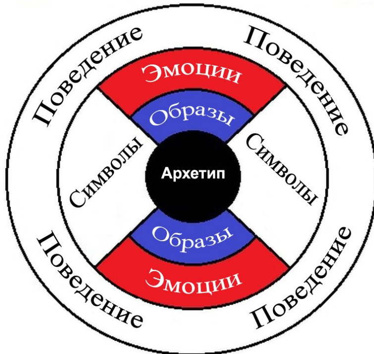
Схема комплекса согласно К. Г. Юнгу

P.S. Новое понятие дало Юнгу известность