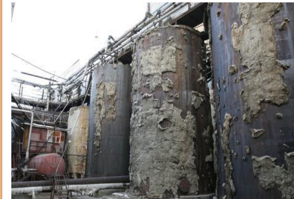
Авария на Байкальском целлюлозно - бумажном комбинате, 2011 год