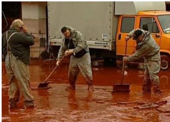
Химическая авария на венгерском заводе, 2010 год