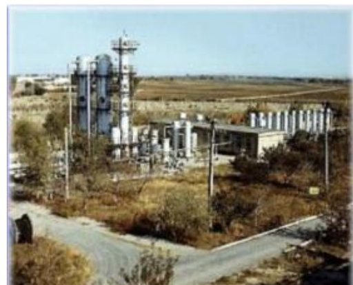
Предприятия химической промышленности