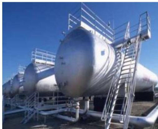
Места хранения АХОВ