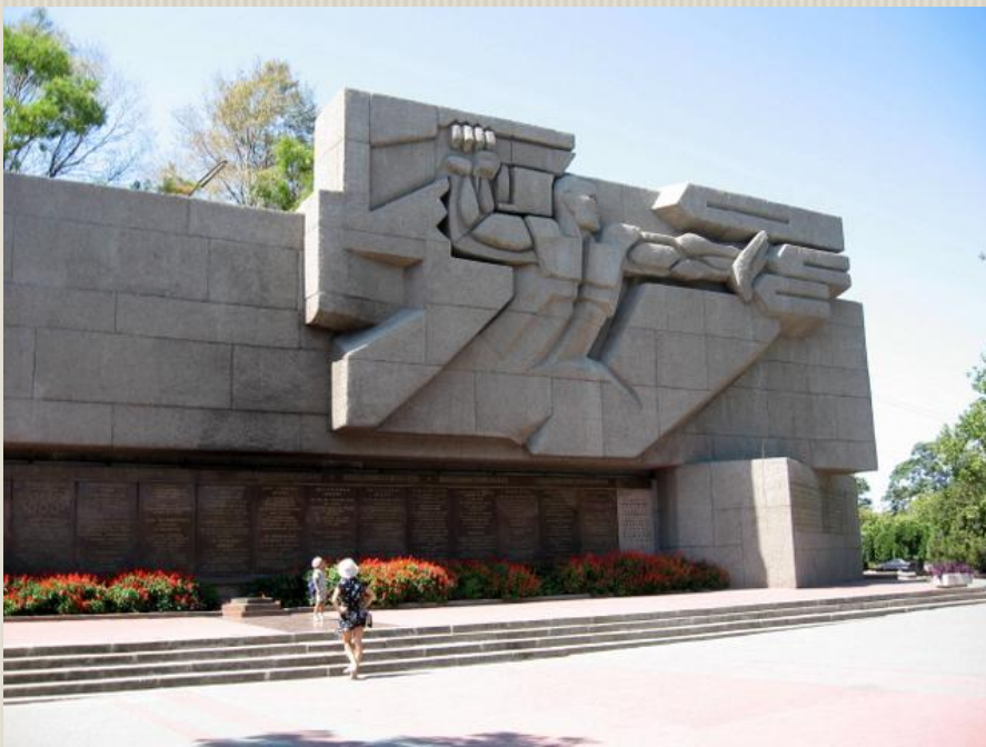
Монументальный памятник посвященный подвигу защитников Севастополя