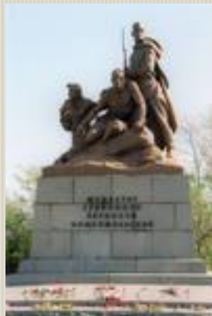
Памятник комсомольцам, погибшим в годы Великой Отечественной войны