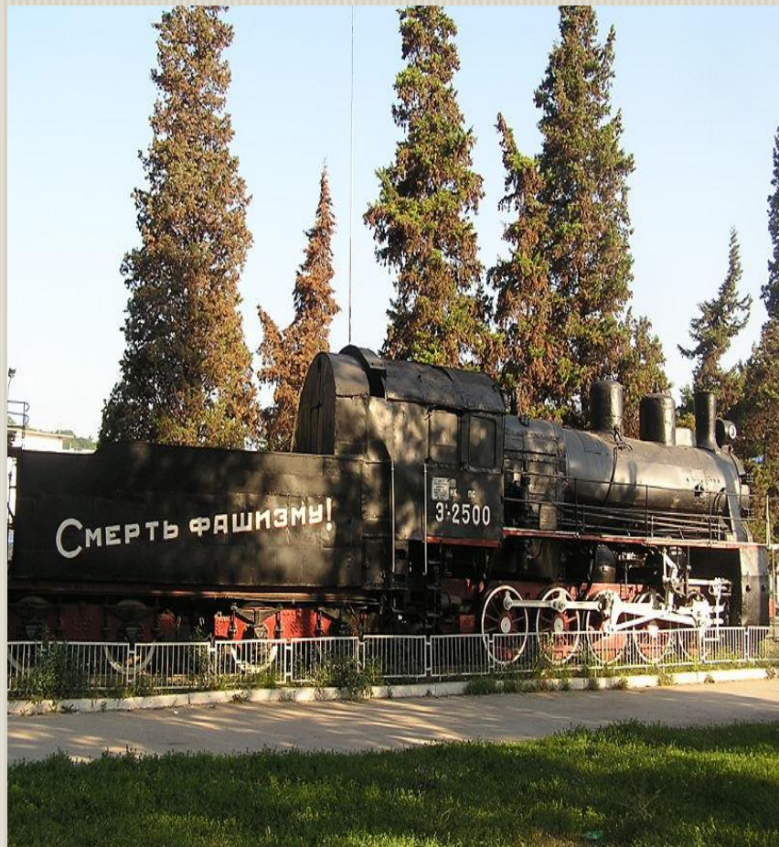
Паровоз бронепоезда «Железняков»