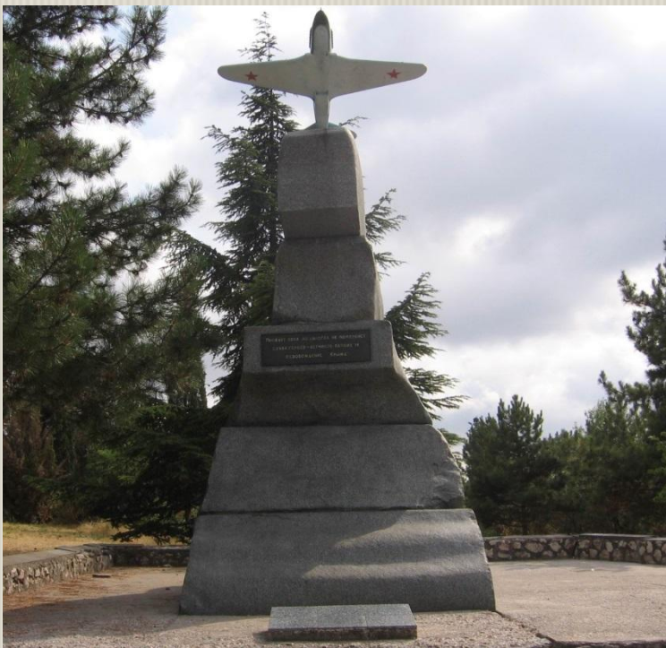
Памятник летчикам 8-й воздушной армии