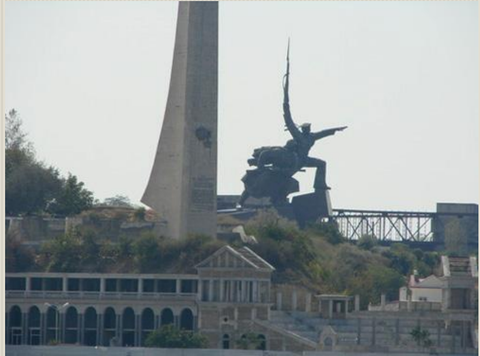
Памятник Героям обороны Севастополя