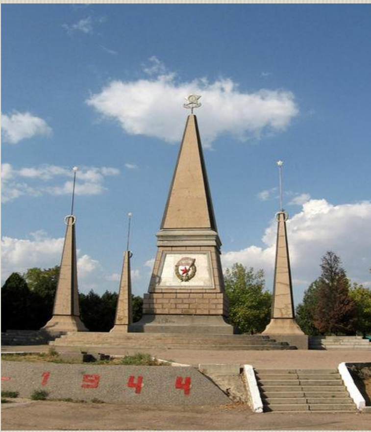
2 – я гвардейская армия