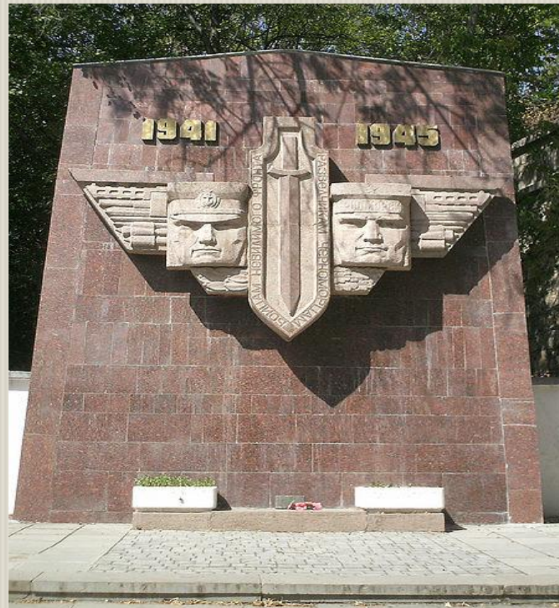
Памятник разведчикам черноморского флота