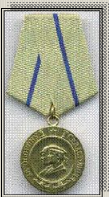
Медаль «За оборону Севастополя»

Медаль «За оборону Севастополя» учреждена Указом Президиума Верховного Совета СССР от 22 декабря 1942 г. Автор рисунка медали – художник Н. Москалев. Положение о медали дополнено «Указом Президиума Верховного Совета СССР» от 19 июня 1943 г., а в описание медали внесены изменения Постановлениями Президиума Верховного Совета СССР от 27 марта и 3 мая 1943 г. Медаль «За оборону Севастополя» вручалась как участвовавшим в обороне города в течение всего периода обороны, так и тем участникам обороны, которые в связи с ранением, болезнью или в порядке проводимых правительственных мероприятий были эвакуированы из города в период его обороны. Медаль «За оборону Севастополя» вручалась защитникам этого города независимо от того, были ли они награждены орденами и медалями за мужество и отвагу, проявленные при обороне города, или нет. Всего медалью «За оборону Севастополя» награждено около 50 тысяч человек.