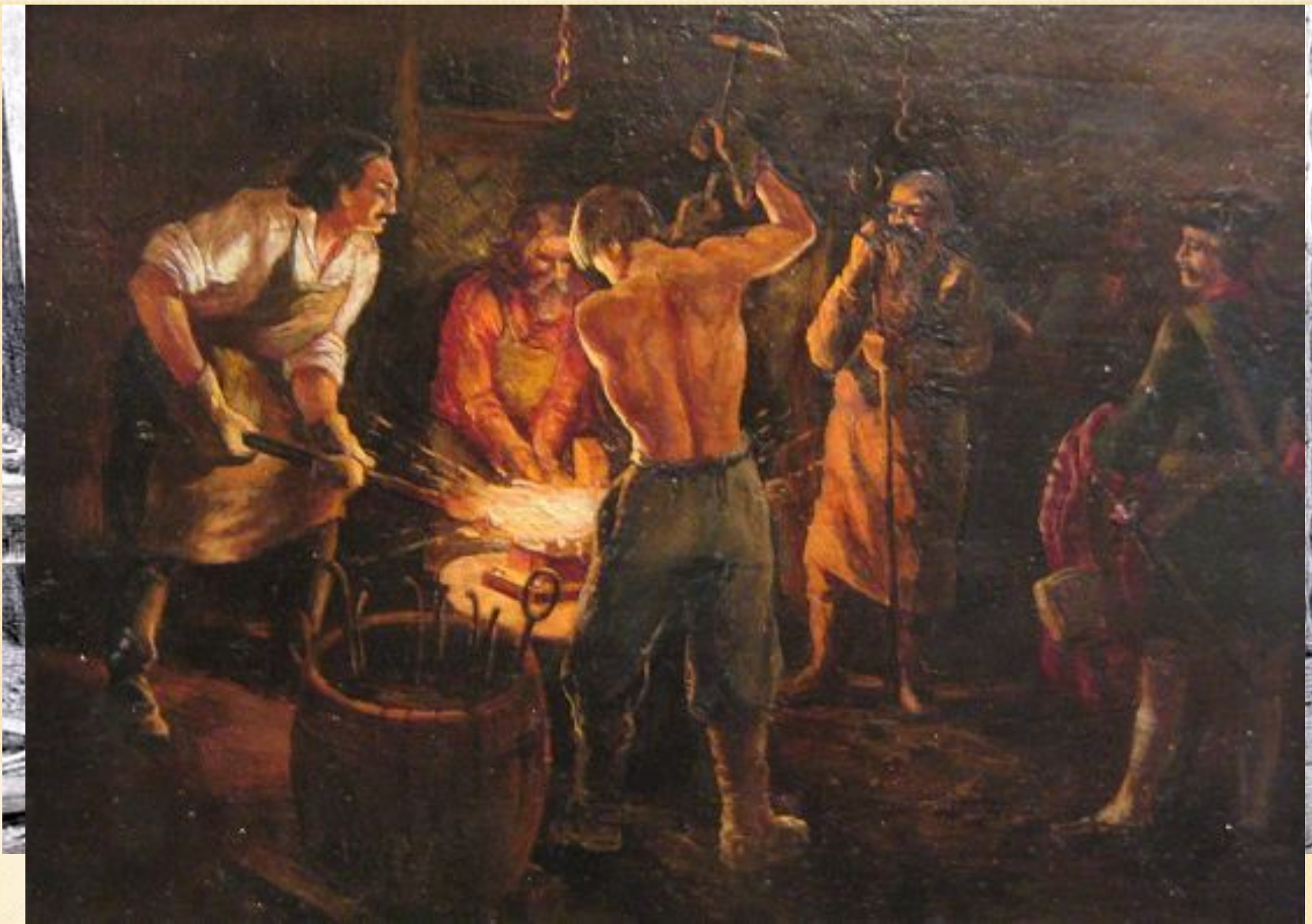
В мастерской (Пётр Исаевичом сменением руля) заводе