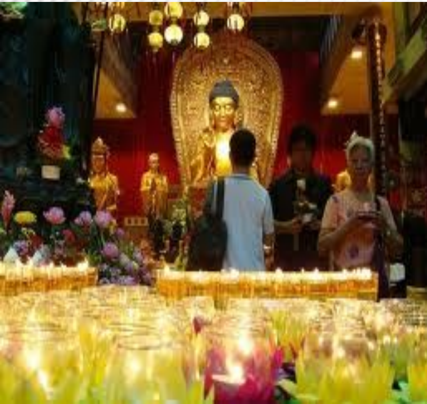
китайский Новый год