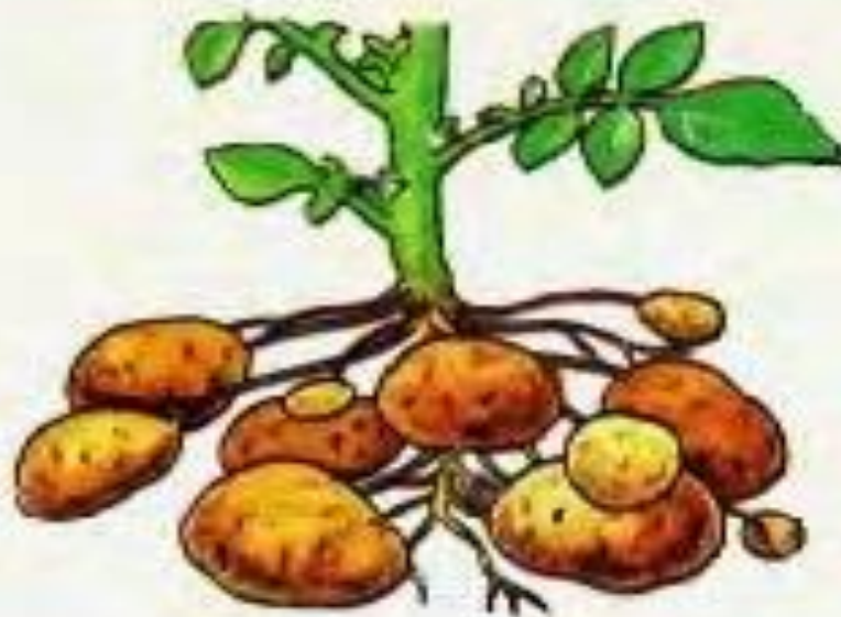
Клубни дикорастущего и культурного картофеля