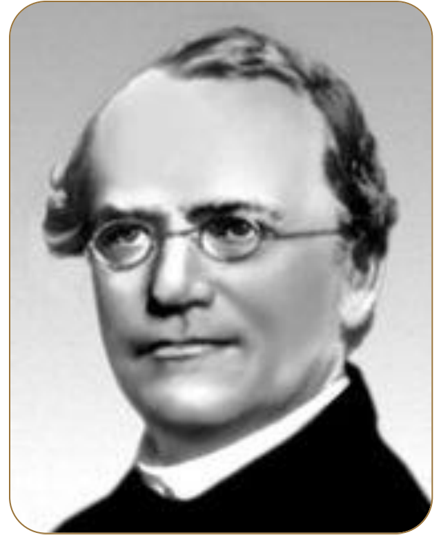
Грегор Мендель (1822 – 1884)

Большой вклад в утверждение экспериментального метода в биологии внес Г. Мендель, который, изучая наследственность и изменчивость организмов, впервые использовал эксперимент не только для получения данных об изучаемых явлениях, но и для проверки гипотезы, формулируемой на основании получаемых результатов. Работа Г. Менделя стала классическим образцом методологии экспериментальной науки.